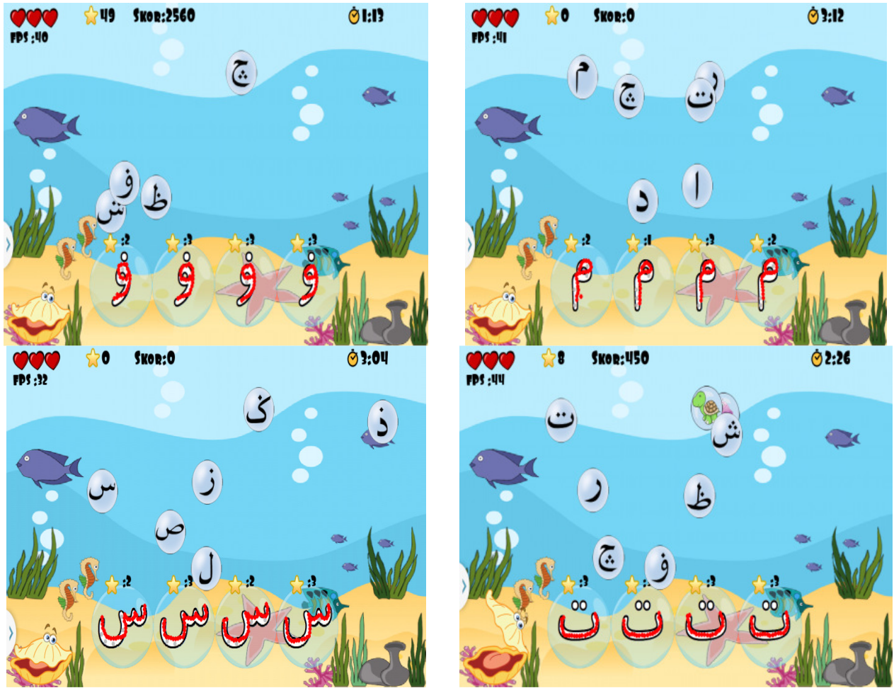
RAJAH 2. Paparan skrin enjin menyurih

Pengguna melakukan aktiviti menyurih sambil bermain dan selepas selesai menyurih empat aksara, kadar bintang yang selayaknya dipapar pada bahagian atas buih iaitu sama ada tidak ada bintang, satu bintang, dua bintang atau tiga bintang seperti dalam Rajah 3.