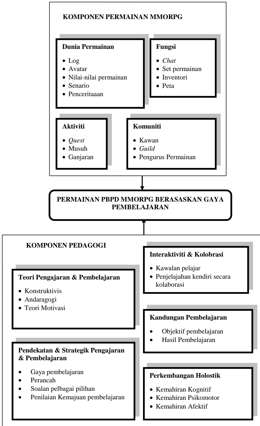
RAJAH 1. Rangka kerja KK-IPGame