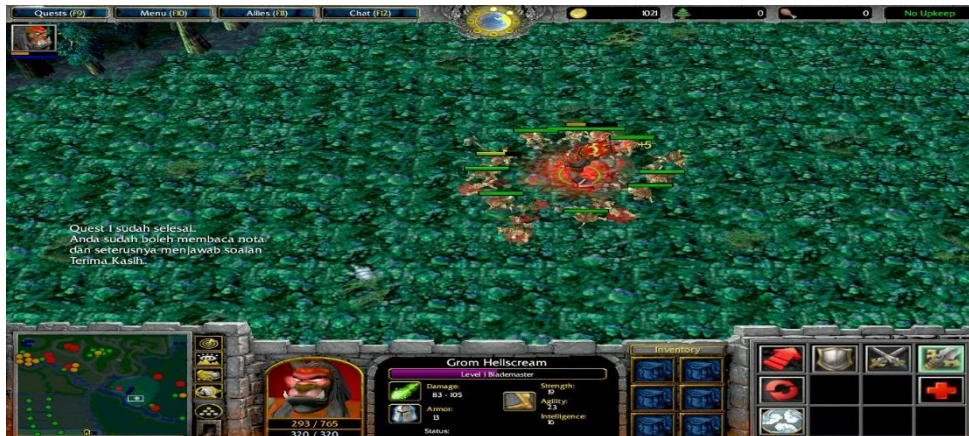
RAJAH 4. Skrin peperangan dengan musuh.

Dalam modul ini, pelajar berada dalam dunia maya pembelajaran mengikut gaya pembelajaran, samada sekutorial atau global. Bagi mewujudkan suasana kolaborasi dan sosial di antara pelajar,