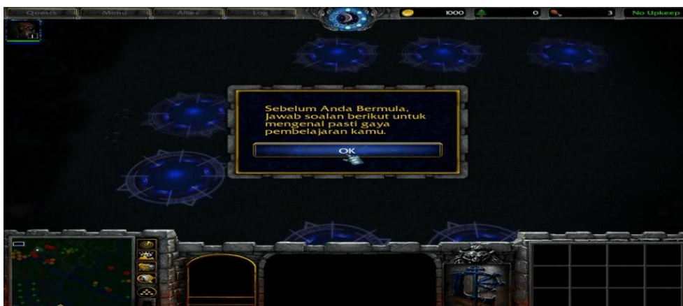
RAJAH 3. Skrin menjawab soalan gaya pembelajaran.

Permainan IPGame memberhentikan soalan ujian pra seketika dan pelajar dibenarkan bermain permainan dalam mod bermain bagi mengelakkan motivasi berkurangan. Dalam mod permainan pelajar terlibat dengan aktiviti pengembaraan, berperang dan membunuh musuh