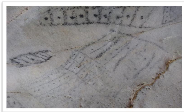
Foto 14. Lukisan bermotif sistem pengiraan