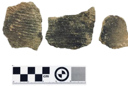
Foto 10. Tembikar bahagian badan bermotif cord mark

Sebanyak 171 pecahan tembikar tanah dijumpai di Gua Lubang Kelawar Batu Tambah sewaktu ekskavasi iaitu terdiri daripada 25 bahagian bibir, 122 bahagian badan dan 24 bahagian karinasi. Jumpaan bahagian badan yang bermotif adalah sebanyak 91 manakala sebanyak 31 bahagian badan yang tidak bermotif. Hanya terdapat satu motif sahaja iaitu motif cord mark yang dijumpai di gua ini. Terdapat juga penemuan gelang batu (Foto 11) yang tidak lengkap bentuknya. Dipercayai bahawa gelang batu ini digunakan untuk tujuan perhiasan pada masa tersebut.