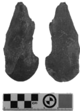
Foto 6. Pengikis

Batu pelicin (Foto 5) dicirikan dengan memiliki kesan guna ataupun kesan calar pada permukaan batu tersebut. Batu pelicin digunakan untuk melicinkan ataupun mengasah alat batu. Pengikis atau scraper (Foto 6) turut ditemui sewaktu ekskavasi arkeologi yang dilakukan di Gua Lubang Kelawar Batu Tambah. Terdapat beberapa jenis pengikis iaitu side scraper , end scraper , convex scraper dan round scraper . Batuan yang digunakan untuk mencipta pengikis di Gua Lubang Kelawar ini ialah batuan jenis sabak. Pada kebiasaanya pengikis diperbuat daripada flake serta dicirikan dengan memiliki bahagian matanya yang tajam dan mempunyai kebolehan untuk mengikis. Pengikis digunakan untuk meraut atau turut digunakan untuk memotong ranting kayu yang kecil.