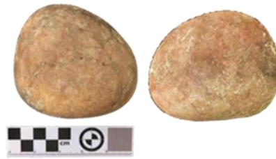
Foto 8. Grind Pounder

Pahat (Foto 7) merupakan salah satu daripada alat batu yang dicipta pada zaman Prasejarah iaitu dipercayai dicipta pada Zaman Neolitik. Pahat memiliki ciri-ciri seperti berbentuk segi empat atau berbentuk silinder dimana matanya berbentuk tirus dan tajam dan digunakan untuk kerja-kerja pertukangan contohnya untuk membuang serat kayu. Grind pounder (Foto 8) biasanya mempunyai kebolehan untuk menghancurkan dan juga mengisar batuan bematite . Terdapat kesan kemerahan pada permukaan grind pounder yang menunjukkan alat ini telah digunakan untuk menghancurkan bematite .