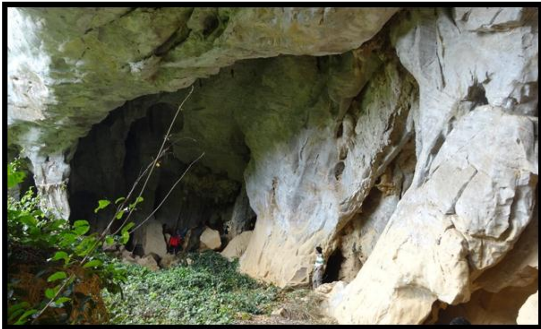
Foto 1. Pandangan hadapan Gua Lubang Kelawar Batu Tambah