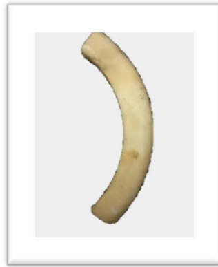
Foto 11. Gelang batu

Sebanyak 171 pecahan tembikar tanah dijumpai di Gua Lubang Kelawar Batu Tambah sewaktu ekskavasi iaitu terdiri daripada 25 bahagian bibir, 122 bahagian badan dan 24 bahagian karinasi. Jumpaan bahagian badan yang bermotif adalah sebanyak 91 manakala sebanyak 31 bahagian badan yang tidak bermotif. Hanya terdapat satu motif sahaja iaitu motif cord mark yang dijumpai di gua ini. Terdapat juga penemuan gelang batu (Foto 11) yang tidak lengkap bentuknya. Dipercayai bahawa gelang batu ini digunakan untuk tujuan perhiasan pada masa tersebut.