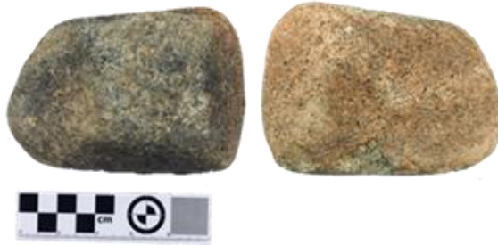
Foto 5. Batu Pelicin

di Gua Lubang Kelawar Batu Tambah ini terdapat penemuan artifak yang dipercayai mempunyai ciri-ciri kebudayaan Zaman Neolitik. Antaranya ialah alat batu seperti batu pelicin, pengikis, pahat dan grind poulder . Selain itu terdapat juga penemuan tembikar tanah dan gelang batu.