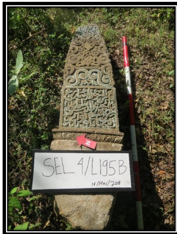
Foto 7: Salah satu batu nisan Plak Pleng di wilayah Makam Sirajul Muluk (SEL 4).

Nisan Plak Pleng yang dijumpai di wilayah Makam Sirajul Muluk hanya mempunyai dua buah batu nisan sahaja. Keadaannya telah roboh dan tidak dijumpai secara insitu . Nisan ini berukuran besar dengan tinggi 100 cm. Bahagian kaki nisan berbentuk segi empat sama semakin ke atas semakin tirus dengan berukuran 25x25 cm. Ornamen atau hiasan yang terpahat pada nisan ini lebih rumit (Foto 4). Bahagian badan bawah dihiasi dengan kaligrafi khat naskhi. Pada badan bahagian atas dihiasi dengan pahatan geometri spiral huruf S yang saling berhadapan membentuk hiasan Kalamakara. Pahatan ornamen kalamakara yang sudah di gayakan sangat jelas terlihat pada bahagian badan nisan dengan jumlah empat tingkat. Kalamakara merupakan simbol yang sering digunakan pada pintu bangunan candi Hindu dan Buddha seperti Candi Mendut dan Candi Kidal di Jawa Tengah (Halim 2017: 23). Bahagian kepala nisan ini telah patah.