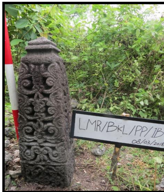
Foto 1. Salah satu batu nisan Plak Pleng di wilayah Banteng Kuta Lubuk (Sel 1)

Terdapat empat buah batu nisan Plak Pleng di wilayah Banteng Kuta Lubuk. Batu nisan ini mempunyai ukuran tinggi 80 cm, bahagian bawah nisan berbentuk segi empat sama ukuran lebar sisi 18x18 cm. Pada satu sisi bahagian kaki nisan paling bawah terdapat ukiran inskripsi kaligrafi dengan menggunakan khat naskhi (Foto 3). Manakala pada sisi lainnya terdapat ukiran bunga. Pada bahagian badan atas nisan dijumpai ornamen flora dan geometri spiral berbentuk huruf S yang diletakkan berlawanan arah. Selanjutnya corak flora atau bungoeng awan sitangke dibahagian badan nisan sejajar dalam empat tingkat. Saluran-saluran bunga juga menghiasi bahagian badan nisan. Seterusnya kepala nisan memiliki dua buah tingkat menyerupai stupa atau lingga.