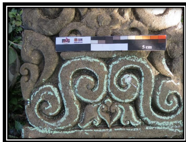
Foto 8 : Corak ukiran geometris spiral yang sudah digayakan membentuk Kalamakara