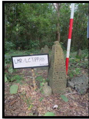
Foto 4: Salah satu batu nisan Plak Pleng di wilayah Lhok Cut (SEL 2)