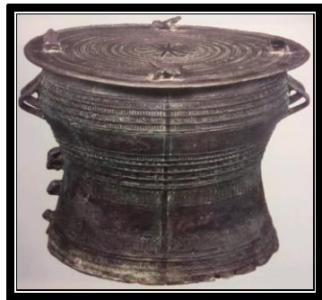
Gendang gangsa LP153(5)