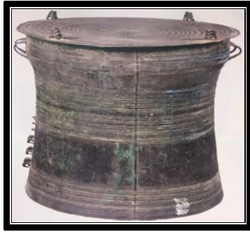
Gendang gangsa C2