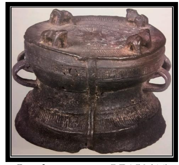
Gendang gangsa LP159(64)