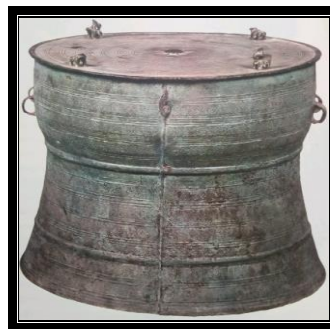
Gendang gangsa W197