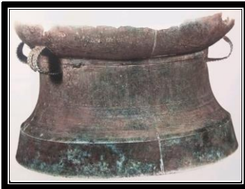
Gendang gangsa LP63