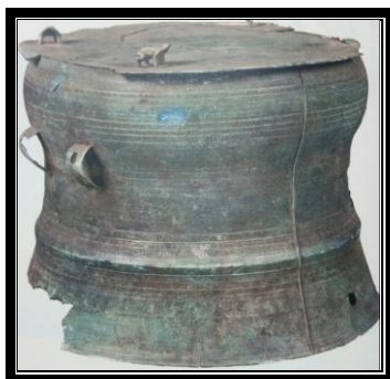
Gendang gangsa C3

Berdasarkan kajian yang dilakukan oleh Li Fuqiang pada tahun 2014, gendang gangsa yang ditemui di Laos daripada jenis Heger II adalah sebanyak lima (5) buah iaitu Gendang gangsa C3, Gendang gangsa S3, Gendang gangsa S4, Gendang gangsa S5 dan Gendang gangsa W197 (Li Fuqiang 2014). Empat (4) buah daripada gendang gangsa jenis Heger II ini ditemui hasil ekskavasi di wilayah Savannakhet dan sekarang dipamerkan di Muzium Nasional Savannakhet. Manakala sebuah lagi ditemui hasil ekskavasi di Champasak dan sekarang dipamerkan di Muzium Sejarah Champasak. Berikut adalah beberapa contoh rupa bentuk gendang gangsa daripada jenis Heger II yang ditemui di Laos (Li Fuqiang 2014).