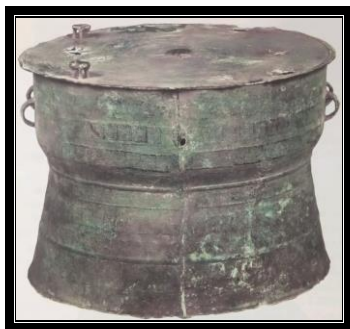
Gendang gangsa S4