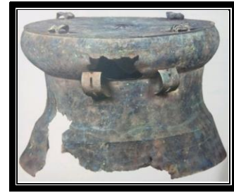
Gendang gangsa S2