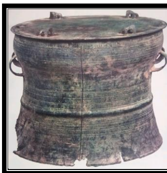
Gendang gangsa S3