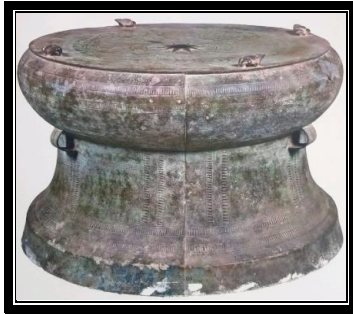
Gendang gangsa C1