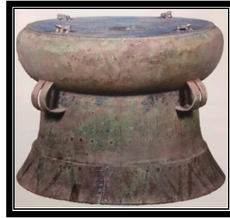
Gendang gangsa S6