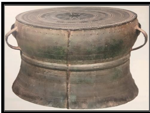
Rajah 5. Gendang gangsa W196