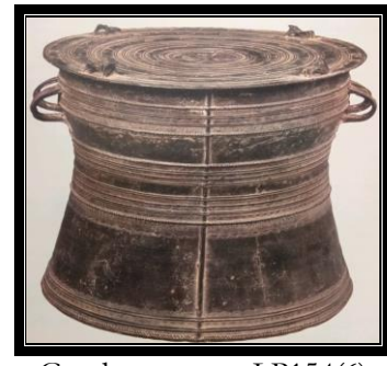
Gendang gangsa LP154(6)