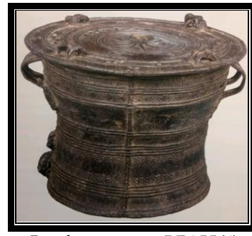
Gendang gangsa LP155(4)