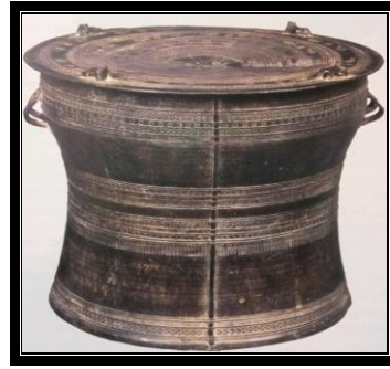
Gendang gangsa LP146(7)