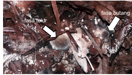
b) Hari ke-14 – 15