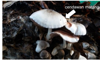
d) Hari ke-17 - 18