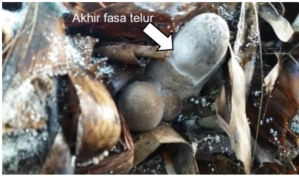
c) Hari ke-16