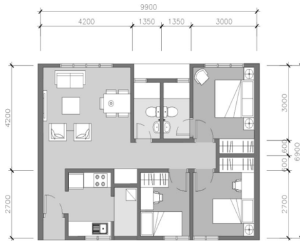
RAJAH 2 Pelan Rumah Kos Rendah PPR di Bandar Rimbayu (Jenis A)

Tanpa mengeneipkan keadaan semasa geopolitik dan domestik di sesuatu tempat yang ingin dibina. Seperti menurut Hwaish (2015) di dalam penulisan kajian kes beliau “Concept of the Islamic House; A Case Study of the Early Muslims House” menyatakan di dalam penutupnya bahawa corak rumah yang bercirikan Islam sepatutnya memberi pertimbangan terhadap budaya dan kepekaan yang sedia ada terhadap keadaan geografi dan domestik, kemahiran buruh dan bahan yang ada serta teknologi bangunan di kawasanannya.