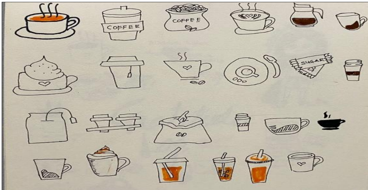
RAJAH 1. Doodle Pertama, Permulaan Menjadikan Aktiviti Melukis Sebagai Terapi.

Rajah 1 adalah lukisan pertama yang menjadi titik permulaan kepada aktiviti melukis sebagai terapi. Penulis menghasilkan lukisan ini apabila mengalami kebuntuan idea dalam menyiapkan satu tugas penyelidikan. Kebetulan pada waktu tersebut penulis sedang minum secawan kopi dan secara automatiknya mendapat idea untuk mencuba melukis kopi secara doodle . Berpandukan tutorial melalui saluran Youtube, penulis dapat menghasilkan lukisan tersebut di atas sehelai kertas kosong di dalam beberapa minit sahaja. Penulis seterusnya mendapat satu kepuasan serta ketenangan apabila berjaya menghasilkan lukisan tersebut. Bermula dari situlah, pada setiap hari penulis akan melukis doodle di atas sebuah buku nota.