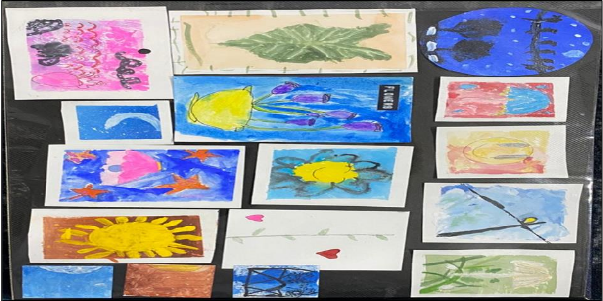
RAJAH 6. Hasil Lukisan Anak apabila Melakukan Aktiviti Melukis Bersama.