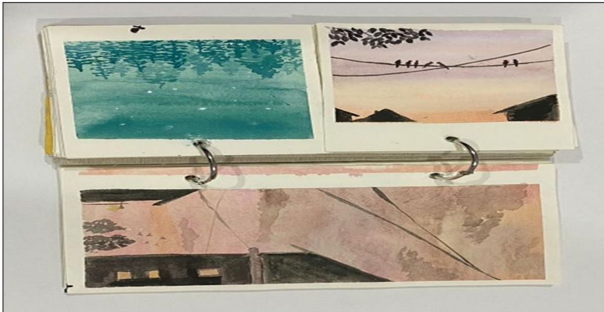
RAJAH 4. Hasil Lukisan di dalam Jurnal Lukisan.

Pada waktu yang sama, penulis juga mengumpulkan karya lukisan di dalam jurnal lukisan (Rajah 4). Satu buku lukisan khas diperuntukkan untuk tujuan tersebut. Dengan adanya jurnal lukisan ini, penulis dapat menjadikan ianya sebagai kenangan dan bukti dokumentasi hasil seni. Dalam pada itu, jurnal lukisan digunakan kerana memiliki tekstur kertas yang berlainan daripada kertas-kertas biasa dan bertujuan sebagai koleksi peribadi. Namun, ada juga permintaan daripada rakan-rakan untuk membeli lukisan daripada jurnal tersebut. Biasanya hasil karya dijual mengikut saiz kertas, jenis medium yang digunakan dan berapa lama masa yang diperuntukkan untuk menyiapkan sesebuah lukisan. Contohnya, lukisan bersaiz B5 menggunakan cat akrilik dijual pada harga RM25, manakala lukisan cat air bersaiz A5 dijual pada harga RM15. Selain itu, lukisan bersaiz 7cm x 10cm dijual pada julat harga RM5 - RM10. Lukisan di dalam jurnal ini juga menampilkan elemen yang sama seperti lukisan-lukisan lain di mana penulis mengetengahkan lukisan pemandangan dan unsur-unsur abstrak serta geometri bagi memberikan impak relaks apabila berkarya. Apa yang dirasai oleh penulis apabila melukis adalah satu ketenangan di mana dapat meninggalkan seketika kesibukan dunia luar dan kembali pada diri. Melalui lukisan seperti lukisan pemandangan akan mengingatkan penulis kepada keindahan Sang Pencipta.