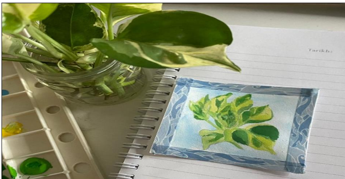
RAJAH 2. Lukisan Objek Sebenar Pertama Kali Dihasilkan.

Rajah 1 adalah lukisan pertama yang menjadi titik permulaan kepada aktiviti melukis sebagai terapi. Penulis menghasilkan lukisan ini apabila mengalami kebuntuan idea dalam menyiapkan satu tugas penyelidikan. Kebetulan pada waktu tersebut penulis sedang minum secawan kopi dan secara automatiknya mendapat idea untuk mencuba melukis kopi secara doodle . Berpandukan tutorial melalui saluran Youtube, penulis dapat menghasilkan lukisan tersebut di atas sehelai kertas kosong di dalam beberapa minit sahaja. Penulis seterusnya mendapat satu kepuasan serta ketenangan apabila berjaya menghasilkan lukisan tersebut. Bermula dari situlah, pada setiap hari penulis akan melukis doodle di atas sebuah buku nota.