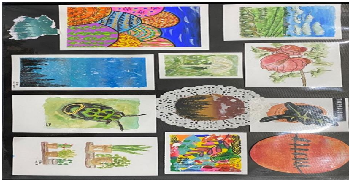
RAJAH 3. Antara Hasil Lukisan di atas Kertas Kecil dan juga Medium lain seperti Kertas Doolies dan Kertas Buatan Sendiri.

Berasaskan kertas kecil dan juga bahan lain seperti kertas doolies , cardboard dan kertas buatan sendiri, penulis dapat mengekspresikan karya dalam perbagai cara. Ini dibantu pula dengan pembukaan kedai alatan tulis sebaik sahaja kelonggaran diberikan kerajaan. Untuk mencapai sasaran ini, penulis akan meluangkan masa selama satu jam sehari, mensasarkan sekurang-kurangnya satu lukisan sehari dan akan melukis apa sahaja yang terlintas di fikiran (Rajah 3). Hasilnya pula bergantung kepada saiz lukisan dan masa yang diluangkan untuk menghasilkan satu karya. Penggunaan medium lain seperti cat akrilik, gouache , krayon dan pen marker digunakan untuk menghasilkan impak dan kualiti lukisan yang berbeza. Dari situ, penulis dapat mempelajari teknik penggunaan medium yang berlainan. Sebagai contoh, lukisan yang bertemakan terumbu karang mengetengahkan konsep abstrak dan juga teknik doodle pada terumbu karang. Bahan yang digunakan adalah cat air yang mana menggunakan teknik ‘kering’ iaitu cat air semata tanpa menggunakan campuran air bagi menghasilkan warna yang terang. Elemen alam semulajadi adalah satu bentuk penciptaan yang indah, menenangkan, terisi dengan keajaiban (Mamat, 2015). Kebanyakan hasil karya penulis bermotifkan alam semulajadi yang mana penulis menikmati dan menghargai keindahan semulajadi.