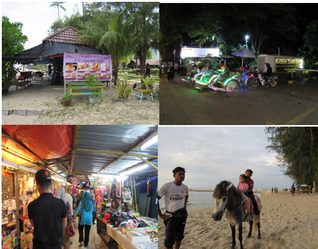
RAJAH 3. Keistimewaan Pantai Batu Ferringhi