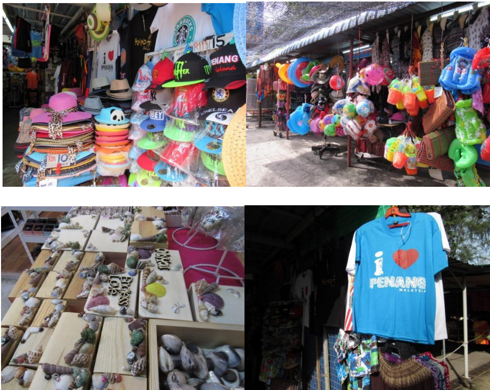
RAJAH 4 Pelbagai cenderamata dijual di sekitar pantai

akses iaitu skor sebanyak 3.78. Bagi kemudahan kedai runcit di setiap lokasi sebanyak 41.7% (125) responden setuju dengan pernyataan ini. Terdapat banyak kedai runcit yang memudahkan pengunjung membeli barang keperluan mereka. Seterusnya, terdapat tempat membeli-belah (cenderahati dan lain -lain) yang menarik dan senang didapati. Sebanyak 48.7% (146) responden memilih neutral. Ini kerana cenderamata mudah untuk didapati di sekitar pantai. Rajah 6 menunjukkan kedai cenderamata yang terdapat di sekitar pantai. Kemudahan farmasi dan klinik berhampiran mencatat skor min 3.60. Adanya klinik atau farmasi ini ia akan memudahkan pengunjung mendapatkan rawatan dengan segera jika berada di dalam keadaan tidak sihat . Rajah 7 menunjukkan klinik satu Malaysia yang terdapat di pantai Batu Ferringhi. Oleh itu, sektor sokongan sangat penting di dalam sesebuah kawasan pelancongan supaya dapat memudahkan pengunjung semasa percutian mereka.