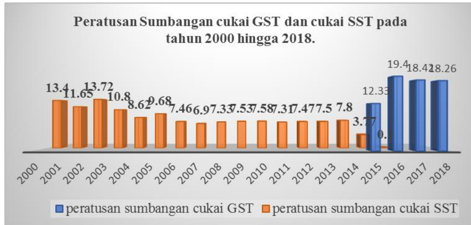
RAJAH 2. Peratusan sumbangan cukai GST dan cukai SST pada tahun 2000 hingga 2018

Peratusan Sumbangan cukai GST dan cukai SST pada tahun 2000 hingga 2018