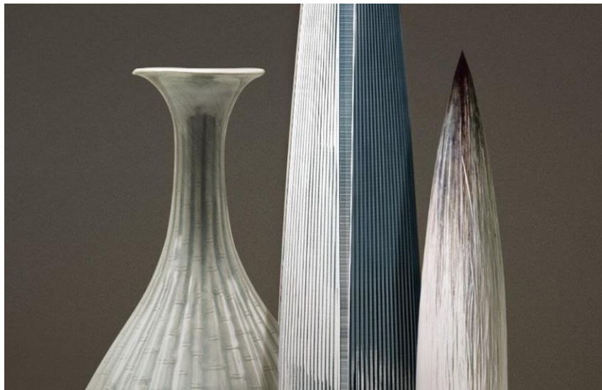
Gambarajah 6 : Celadon Bottle dan Brush of Korea yang menjadi konsep reka bentuk Lotte World Tower. Sumber: Lotte World Tower.

Rekabentuk Lotte World Tower diilhamkan dari seni tembikar, porselin dan kaligrafi Korea yang bersejarah. Lengkungan Lotte World Tower menunjuk ke arah pusat bandar lama. Rekabentuk Lotte World Tower mentafsirkan semula seni kraf tempatan dengan menerapkan unsur-unsur daripada Celadon Bottle with Bamboo Design Relief yang merupakan antara kraftangan tradisional Korea yang masyhur. Rekabentuk bangunan ini juga mencerminkan Brush of Korea , yang menggambarkan kiasan terhadap kesusasteraan Korea.