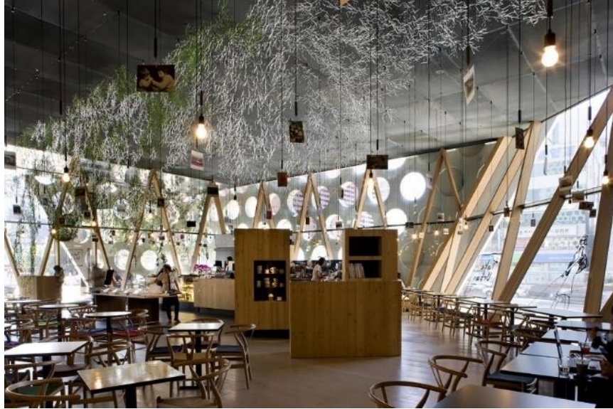
Gambarajah 2 : Ruang awam ketinggian berganda (double volume) pada aras lantai.