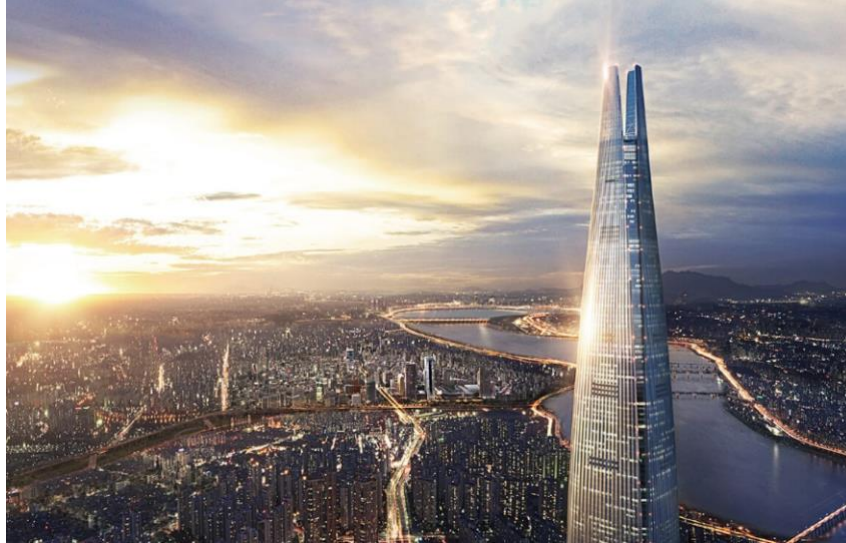
Gambarajah 5 : Gambaran Lotte World Tower dengan berlatarbelakangkan Sungai Han yang berdekatan.