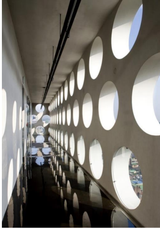
Gambarajah 4 : Ruang legar keliling bangunan yang menjadi ruang perantaraan.

Dalam rekabentuk Urban Hive, arkitek Kim In Cheurl telah mentafsirkan semula prinsip-prinsip rekabentuk rumah tradisional Korea Selatan dan menerapkan unsur tersebut dalam rekabentuk bangunan menara pejabat tersebut. Susunan ruang-ruang dan struktur Urban Hive mencontohi rekabentuk ruang rumah tradisional Korea Selatan, seperti penggunaan struktur kulitan luaran, ruang dalaman yang bebas tiang, ruang awam sebagai ruang pengantaraan dan laluan di sekeliling bangunan yang menghubungkan ruang dalaman. Dengan kaedah ini, suatu pejabat yang selesa yang mencerminkan ruang kediaman tradisional dapat dihasilkan. Struktur kulitan luaran yang mempunyai bukaan tingkap bulat berkepingan kaca memberikan pencahayaan semilajadi kepada ruang legar keliling disamping dapat memberikan peluang penglihatan ke arah luar bangunan.