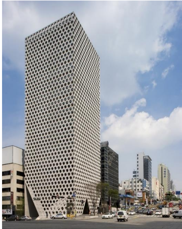
Gambarajah 1: Dinding luaran sebagai struktur kulitan utama bangunan (main structural skin)

Antara unsur yang diterapkan bagi memberikan nilai identiti senibina dalam bangunan Urban Hive adalah menerusi dindingnya yang berperanan sebagai struktur kulitan utama bangunan ( main structural skin ). Dinding ini mencerminkan kecirian rumah tradisional Korea yang mempunyai tiang di bahagian luar sebagai struktur utama. Reka bentuk ini membolehkan ruang dalaman bangunan yang bebas daripada tiang untuk pelbagai kegunaan.