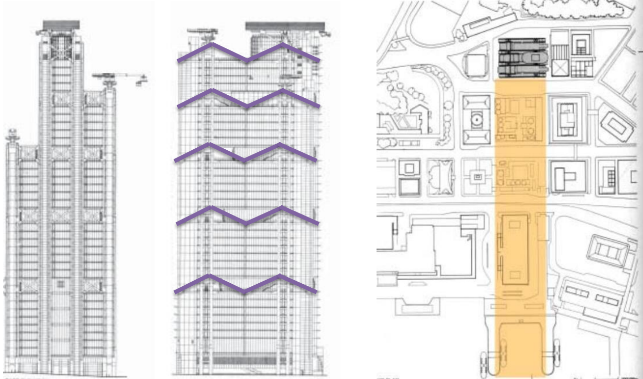
Gambarajah 3: Pandangan sisi dan pelan tapak menunjukkan bagaimana HSBC Tower memberi respon kepada konteks setempat