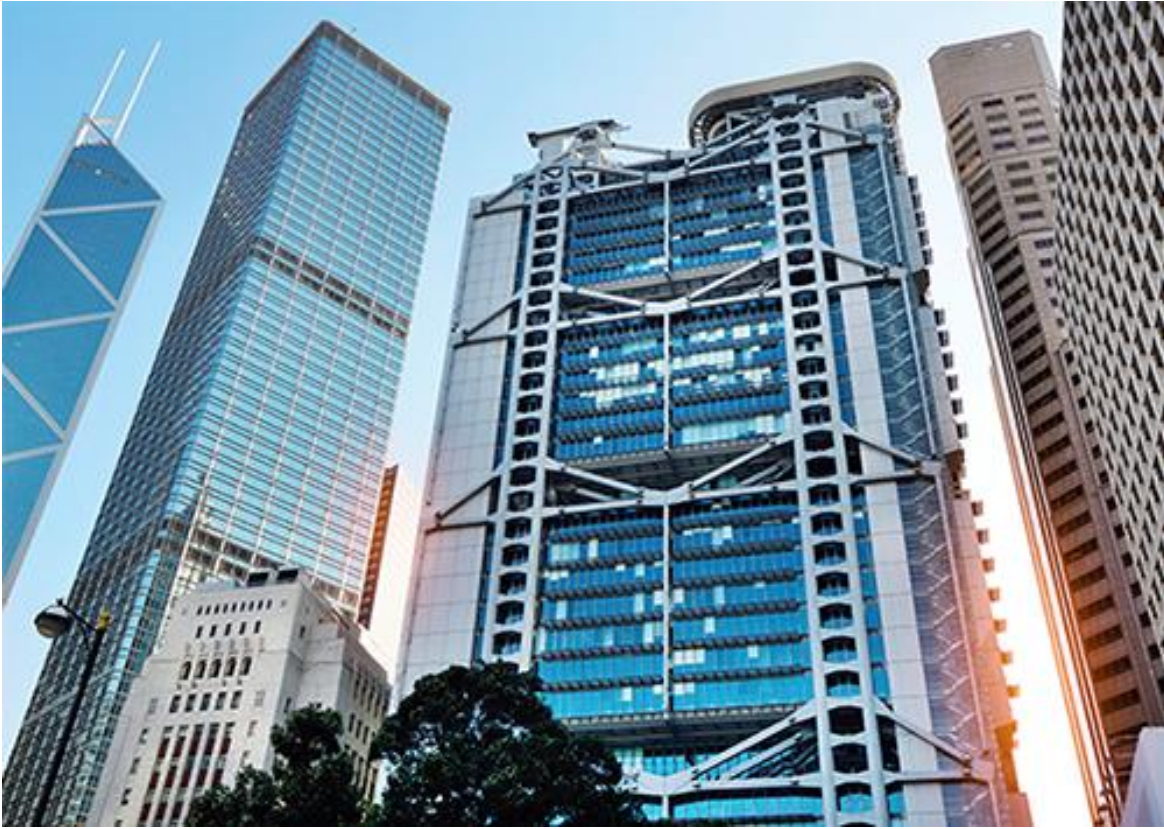
Gambarajah 1: HSBC Tower, Hong Kong oleh Norman Foster

Bangunan HSBC merupakan bangunan terawal di Hong Kong yang menggunakan kaedah pasang siap dan mengambil masa kira-kira kurang daripada 5 tahun untuk disiapkan, ia merupakan bangunan terawal Norman Foster. Tinggi bangunan ini ialah 180 meter iaitu 47 tingkat dan 4 tingkat bawah tanah. Jumlah kawasan yang dibina ialah seluas 90,000 sqm. Falsafahnya adalah;