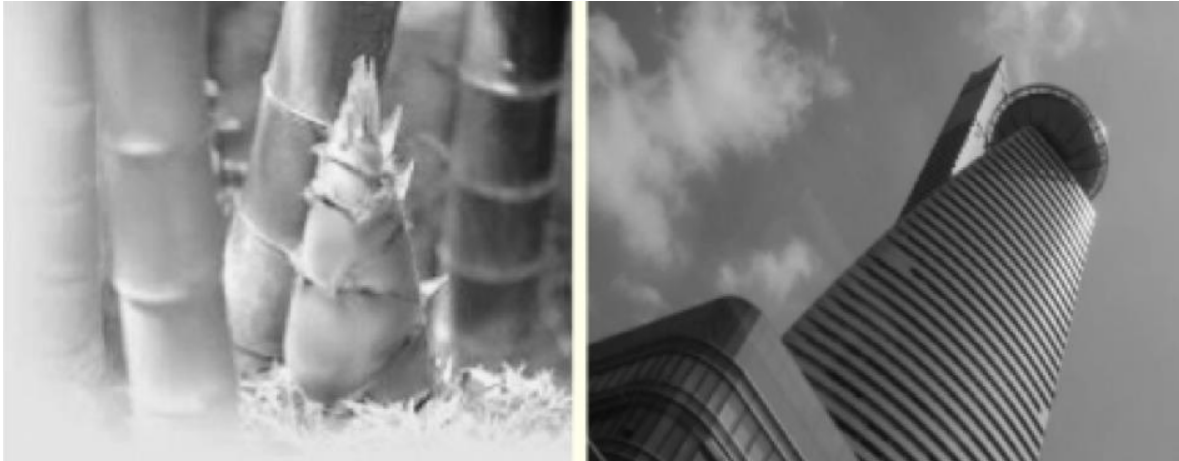
Gambarajah 5: Reka bentuk bangunan yang berkonsepkan pucuk rebung, suatu elemen setempat.

Reka bentuk dari HKAS mempunyai penceritaan dari penggunaan bahan binaan yang kreatif, dan mengikut konteks urban tersendiri. Pandangan dari jauh menunjukkan bangunan ini lebih meyerlah dari segi reka bentuknya yang organic berbanding bangunan-bangunan lain disekitarnya. Menurut HKAS, idea utama termasuk mewujudkan taman-taman langit dengan memasukkan kebun-kebun teras bagi membina bangunan yang sensitif terhadap alam sekitar serta melembutkan permukaan luaran bangunan ketika berfungsi sebagai penyaring hidup haba, cahaya dan bunyi untuk pengguna. Sky garden juga diwujudkan dia setiap tiga aras Menara Telekom.