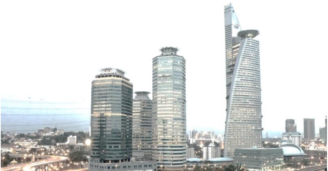
Gambarajah 4: Menara Telekom dan konteks sekeliling

Menara Telekom Malaysia - Hijjaz Kasturi Associates