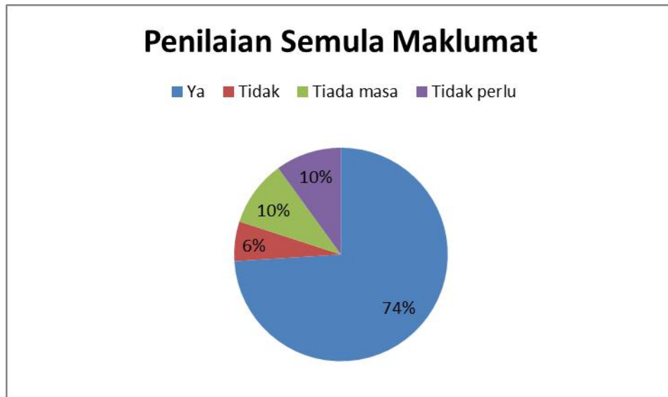
RAJAH 3. Penilaian semula maklumat yang disampaikan dalam sumber maklumat (peratus)