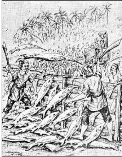
GAMBAR 4. Suatu muslihat untuk membersihkan Singapura daripada todak-todak raksasa. (Diambil dari novel A. Samad Ahmad, Singapura DiLanggar Todak , 1951?: 64)

kesayangannya, Tun Juita 25 , puteri Sang Rajuna Tapa, mempunyai kekasih. Sultan menghukumnya dengan hukuman sula. Bapanya merasa amat malu sehingga untuk membalas dendamnya, dia membuka pintu bandar untuk tentera Majapahit yang menakluki Singapura [kenyataannya, Singapura tidak ditakluki orang Jawa, tetapi oleh orang Siam; cf. Chambert-Loir 2005:137]. Dia akhirnya menebus dosanya kerana, ketika rakyat mengetahui pengkhianatannya, dia dikejar, begitu juga isterinya: suami isteri ini tidak mempunyai pilihan lain kecuali terjun ke dalam sungai.