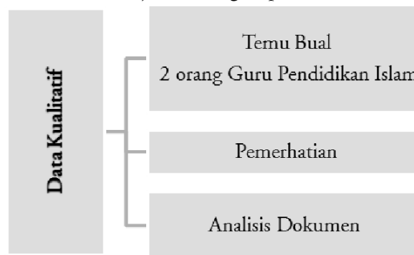
Gambarajah 1: Pengumpulan Data