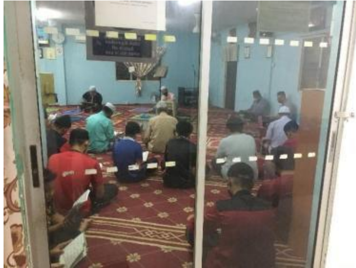
Gambarajah 21 Ceramah agama yang dijalankan di surau

Ceramah keagamaan dilakukan secara berskala setiap hari Selasa malam Rabu di surau dan diikuti dengan moreh di tempat duduk hadapan surau. Aktiviti seumpama ini bagus dari segi rohani dimana ia dapat menarik minat anak-anak muda untuk ke surau pangsapuri (Rajah 21).