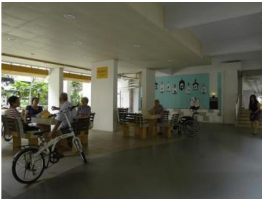
Gambarajah 5 Dek kosong digunakan sebagai ruang untuk berinteraksi dan bersosial

'Void Deck' atau dek kosong, didefinisikan oleh Skelton dan Hamed (2011, 216-217) sebagai kawasan awam terbuka teduh yang selalunya disejukkan dengan udara semulajadi di tapak perumahan pangsapuri. Badan Pembangunan Perumahan (HDB) yang direka sebagai ruangan komuniti. Menurut Giok Ling Ooi and Thomas T.W. Tan (2009), Pangsapuri HDB pertama dibina boleh dijejak hingga ke awal tahun 1970-an di mana perumahan Toa Payoh mempunyai ruangan untuk penduduk pada aras bawah, dan sejak itu 'Void Deck' atau ruangan kosong di aras bawah setiap blok perumahan dijadikan ciri seni bina perumahan HDB dari tahun 1970 (rajah 5).