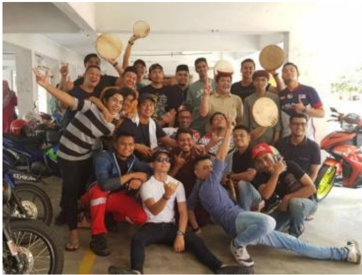
Gambarajah 19 Aktiviti kompang yang dilakukan di ruangankolong pangsapuri