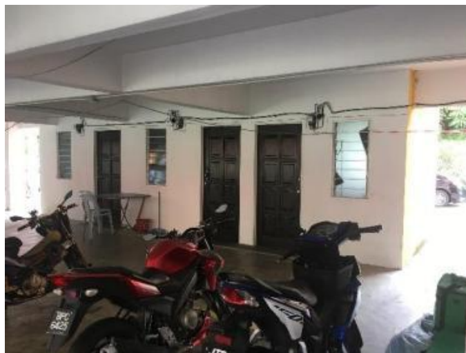
Gambarajah 24 Bilik kuarantin pesakit Covid-19

Ruang kolong menjadikan rekabentuk pangsapuri lebih fleksibel. Ruang yang kurang digunakan didindingkan dijadikan bilik kuarantin (Rajah 24) pesakit Covid-19 ketika virus ini sedang memuncak pada tahun 2020. Setelah wabak reda bilik ini disewakan untuk menjana pendapatan untuk pihak pengurusan pangsapuri.