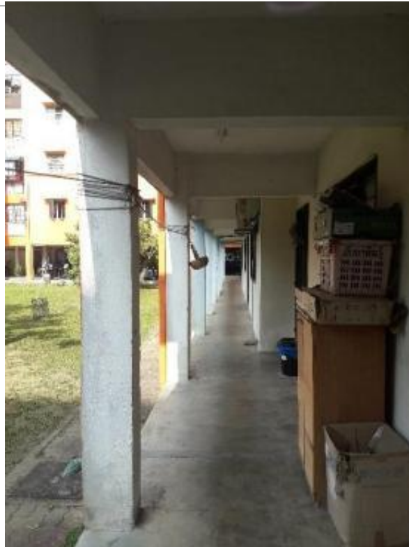
Gambarajah 16 Ruangan kolong blok 4 yang lengang pada waktu awal pagi

Blok 5 Ahad (27 Mac 2022, 6 pagi – 12 tengah hari)