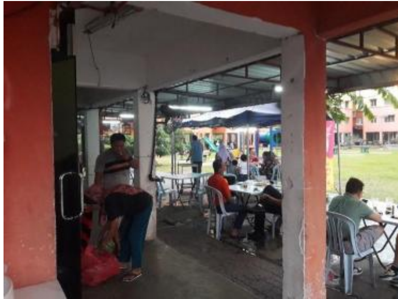
Gambarajah 11 Kedai makan dipenuhi pengguna pada waktu pemerhatian

Blok 4 Khamis (24 Mac 2022, 12.00 tengah malam – 6 pagi)