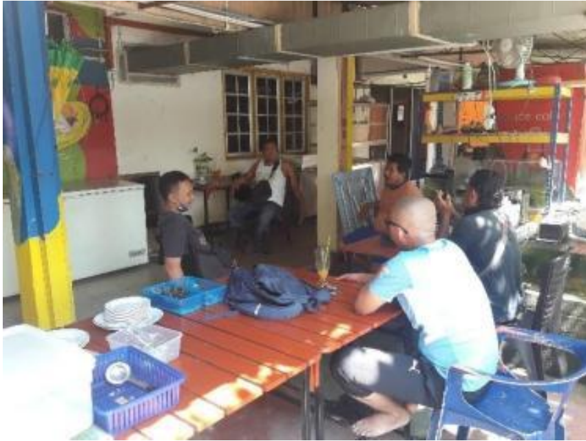
Gambarajah 17 Suasana pagi kedai makan yang terdapat di blok 5