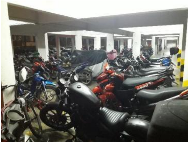
Gambarajah 15 Ruangan parkir motosikal blok 5 yang penuh pada waktu malam

Blok 4 Ahad (27 Mac 2022, 6 pagi – 12 tengah hari)