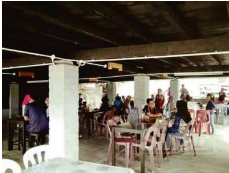
Gambarajah 2 restoran di bawah ruangan kolong rumah Melayu tradisional

Pada zaman ini, kehadiran kolong dalam reka bentuk rumah Melayu kian menghilang, namun terdapat juga segelintir masyarakat yang mengekalkan reka bentuk rumah berkolong. Seperti yang yang dinyatakan dalam surat akbar Sinar Harian pada 2 Mac 2022, kolong merupakan ruang di bawah rumah Melayu tradisional untuk berehat boleh dijadikan tarikan jika digunakan dengan betul. Kenyataan ini merujuk kepada kedai makan yang diwujudkan di bawah kolong sebuah rumah di negeri johor (Rajah 2). Selain itu, petikan daripada akhbar kosmo pada 22 september 2021, menulis tentang seorang usahwan yang menanam cendawan di bawah ruangan kolong rumah. Penulisan-penulisan ini menunjukkan bukti potensi kolong dalam dunia moden ini untuk melaksanakan aktiviti merupakan sebuah idea yang boleh dijalankan (Rajah 3).