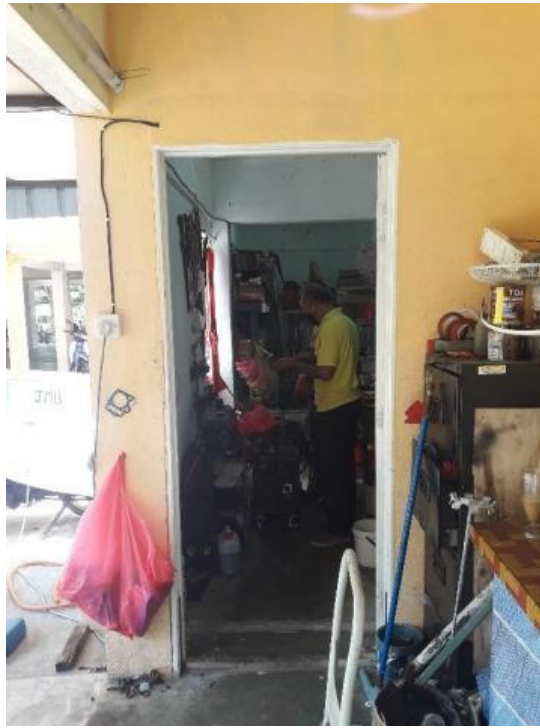
Gambarajah 25 Stor membuat parang

Ruang kolong turut menjadikan rekabentuk pangsapuri lebih fleksibel dengan membolehkan stor diwujudkan di bahagian bawah pangsapuri untuk kegunaan awam penduduk seperti stor membuat parang (Rajah 25) dan stor simpanan barang surau (Rajah 26). Stor simpanan barang surau merupakan ruang yang diubahsuai oleh penduduk sendiri dengan mendinding sebahagian kawasan untuk dijadikan stor.