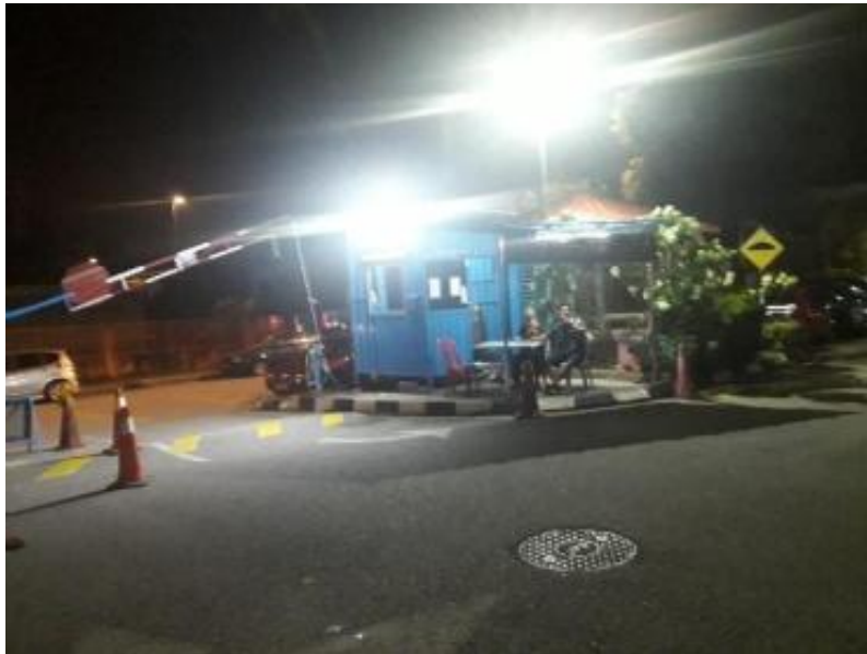
Gambarajah 14 Pondok pengawal yang beroperasi pada waktu malam