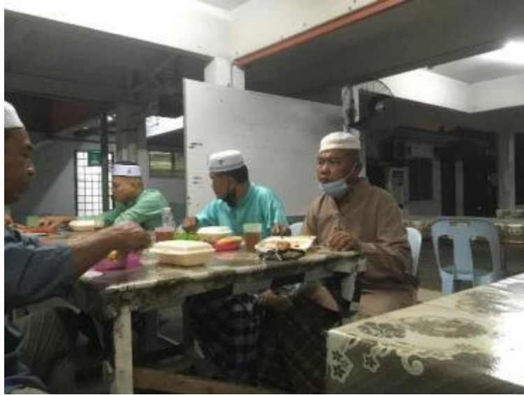
Gambarajah 10 Aktiviti moreh bawah kolong di tempat duduk hadapan surau.

Blok 5 Rabu (23 Mac 2022, 6 petang – 12.00 tengah malam)