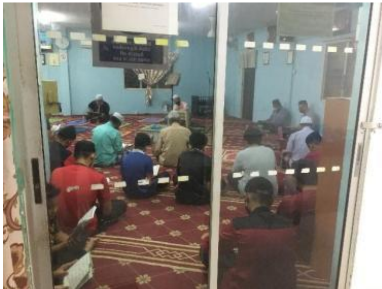
Gambarajah 10 Aktiviti ceramah agama yang dilakukan di surau yang terletak di ruang kolong pangsapuri.