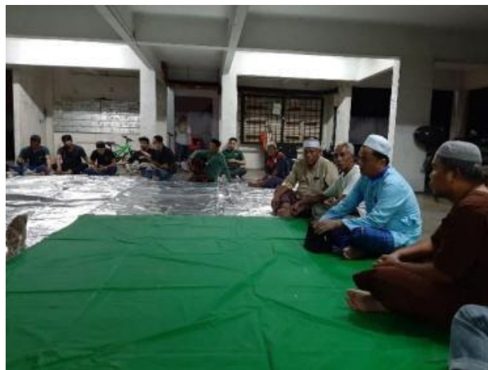
Gambarajah 22 Tahlil jenazah di ruangan kolong

Oleh kerana ruangan rumah yang sempit, tahlil (Rajah 22) dan pengurusan jenazah (Rajah 23) dilakukan di ruangan kolong pangapuri dimana penduduk berkumpul dan bekerjasama bagi mengurus majlis