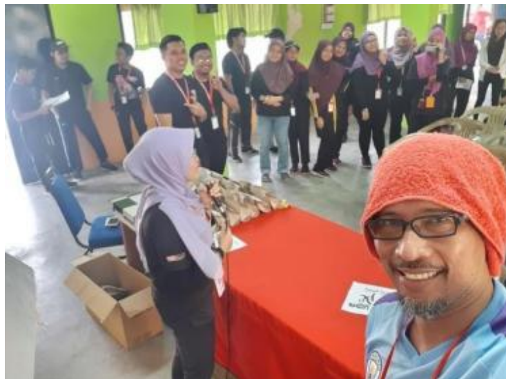
Gambarajah 20 Perjumpaan yang diadakan di dewanserbaguna

Dewan serbaguna menurut responden digunakan untuk apa-apa perjumpaan antara penduduk (Rajah 20). Dewan ini memudahkan penduduk untuk menjalankan perbincangan serta membawa pulang kewangan apabila disewakan kepada pengguna luar. Harga sewaan pada waktu kajian merupakan RM150 untuk satu hari. Ternyata dewanbukan sahaja digunakan oleh penduduk malah disewa oleh pengguna luar untuk mesyuarat dan persatuan.