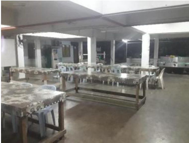
Gambarajah 12 Ruangan tempat duduk hadapan surau yang selalu digunakan oleh pelajar Politeknik Shah Alam yang menyewa di Pangsapuri Seri Melewar untuk belajar.