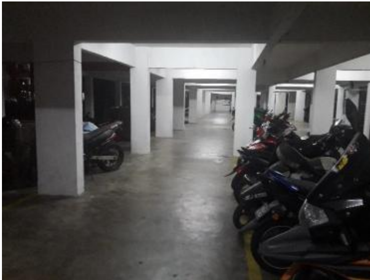
Gambarajah 13 Ruangan parkir motosikal blok 4 yang lengang walaupun pada waktu malam kerana pengguna memilih untuk memarkir motosikal di parkir blok 5.