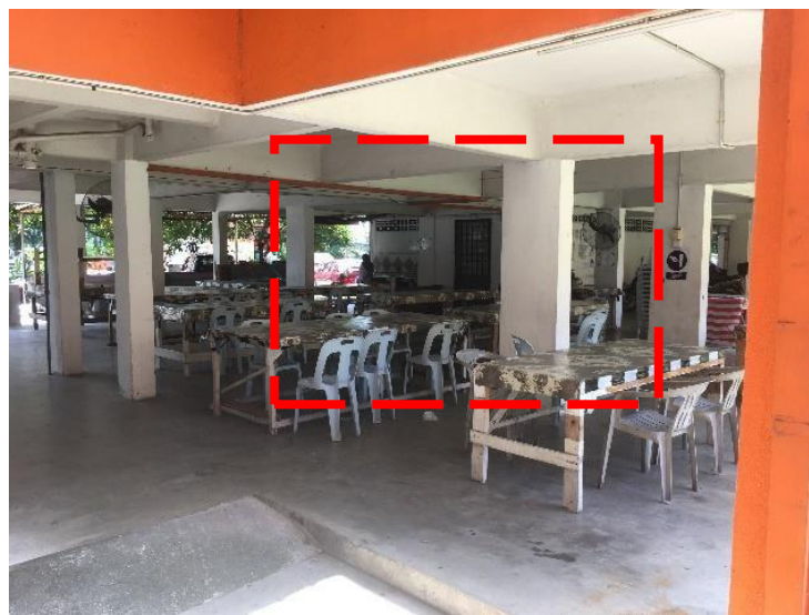
Gambarajah 26 Stor simpanan barang surau (Petak merah)