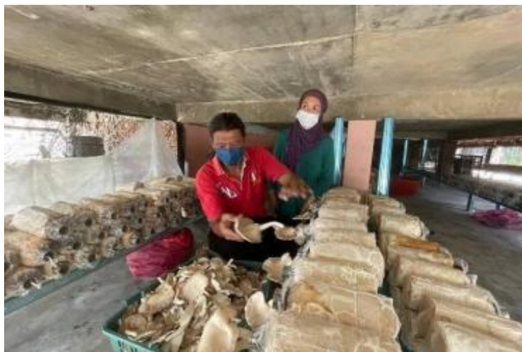
Gambarajah 3 ruangan kolong digunakan untuk menanam cendawan