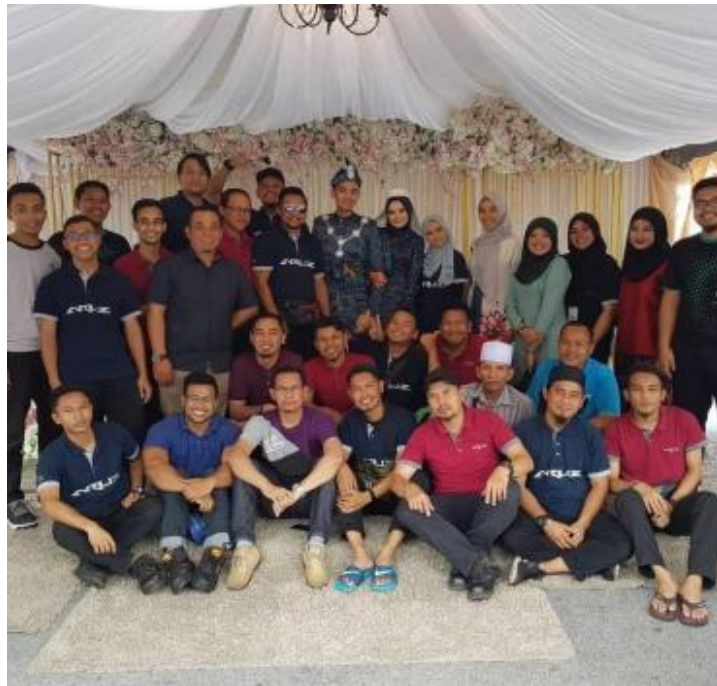
Gambarajah 18 Ilustrasi majlis perkahwinan yang dijalankan di ruangan kolong pangsapuri

Berdasarkan temubual yang dijalankan oleh pengkaji bersama penduduk pangsapuri, didapati bahawa dewan serbaguna dan ruangan kolong pangsapuri digunakan oleh penduduk untuk upacara rewang dan majlis kahwin (Rajah 18). Selain itu, dewan serbaguna ini juga digunakan untuk sambutan hari lahir oleh penduduk. Dewan dan kolong pangsapuri membolehkan penduduk melaksanakan aktiviti rewang seperti di kawasan kampung dengan selesa. Aktiviti rewang ini juga berdasarkan temuduga penduduk berupaya merapatkan hubungan komuniti antara penduduk. Ini kerana penduduk akan berkumpul dan berinteraksi antara mereka yang boleh merapatkan lagi hubungan silaturrahim.