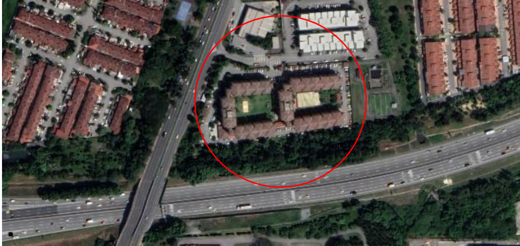
Gambarajah 6 Lokasi Pangsapuri Seri Melewar