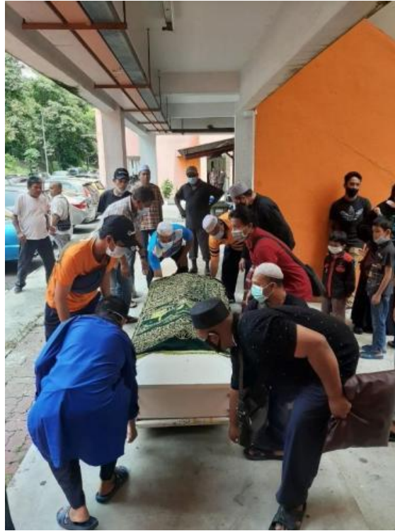
Gambarajah 23 Pengurusan jenazah di ruangan kolong