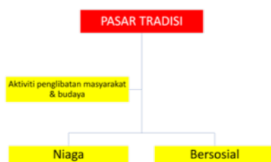
RAJAH 1. Peranan Pasar Tradisi

Pasar tradisional berperanan sebagai sebuah tempat yang kehidupan untuk berniaga dan berbelanja, tempat masyarakat berkumpul, tempat masyarakat bertemu dan berinteraksi untuk memenuhi keperluan dan kehendak individu secara turun-temurun. Pasar tradisional juga merupakan ruang atau tempat yang mana barangan, cenderahati dan produk komuniti tempatan diperdagangkan (Ghapar et al. 2014). Kewujudan pasar tradisional masa kini ini masih menjalankan aktiviti-aktiviti penglibatan komuniti setempat dan berfungsi di persekitaran pekan-pekan kecil (Ida Bagus 2016).