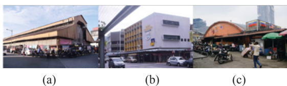
RAJAH 2. Dari kiri, (a) Pasar Taiping, (b) Pasar Chowrasta, dan (c) Pasar Pudu

Perkembangan isu semasa yang berlaku dengan keadaan semula jadi dan aplikasinya dalam praktis telah menjurus kajian ini dijalankan secara kualitatif.