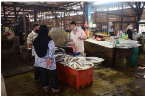
RAJAH 5. Proses tawar-menawar antara pengunjung dan peniaga secara langsung (Pasar Taiping)

Hasil kajian menunjukkan bahawa penglibatan komuniti yang melawati ketiga-tiga pasar ini adalah masyarakat setempat yang tinggal berdekatan di sekitar pasar. Penglibatan komuniti yang terlibat dengan pasar tradisi ini terdiri daripada lapisan umur dan kebanyakan pengunjung adalah berusia sekitar 26 tahun ke atas. Rata-rata pengunjung di pasar tradisi ini menunjukkan bahawa mereka tergolong dalam golongan yang berpendapatan sederhana dan rendah. Ketiga-tiga pasar tradisi ini menerima pengunjung tetap dan berulang dari masyarakat setempat. Kebanyakan pengunjung sering melawati pasar tradisi bersama keluarga, pasangan dan secara individu. Rata-rata pengunjung di pasar ini adalah terdiri daripada masyarakat setempat yang telah menetap lebih dari 30 tahun di sekitar bandar warisan dan pasar tradisi.