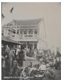
RAJAH 3. Suasana di Pasar Payang, 1906

Nilai sejarah pada pasar tradisional adalah suatu perkara yang amat penting bagi mengekalkan budaya jual-beli dari satu generasi ke generasi seterusnya. Menurut Residen British, Frank Swettenham, (1893) “...adalah menjadi lumrah bahawa di setiap kawasan perlombongan seharusnya ada sebuah bandar dan pasar”. Hasil kajian mendapati bahawa nilai sejarah yang terkandung pada pasar tradisi tapak yang dikaji mempunyai beberapa persamaan dalam punca mengapa pasar ini diwujudkan. Ketiga-tiga pasar tradisi itu wujud ketika aktiviti perlombongan timah dijalankan. Seterusnya, kegiatan ekonomi bermula di kawasan tersebut. Setelah sektor kegiatan ekonomi mula dibangunkan, ia diikuti dengan pembangunan jalan raya bagi menyokong sistem pengangkutan dan ruang komersial. Kemunculan kemudahan seperti jalan raya, penempatan serta ruang komersial dapat membentuk sebuah bandar yang mencorak kehidupan masyarakat untuk berkumpul, bertemu, melakukan aktiviti jual beli, aktiviti kebudayaan dan sebagainya. Ini menunjukkan masyarakat mula membina sebuah kehidupan dan sara diri kehidupan mereka di bandar.