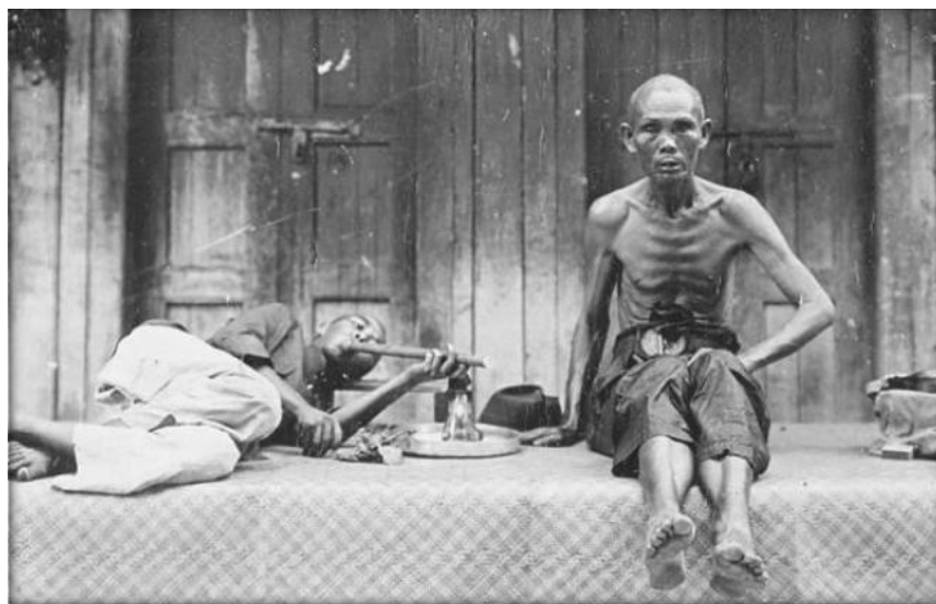
Rajah 2. Pekerja Cina lombong bijih timah sedang menghisap candu, akhir abad ke-19/ awal abad-20