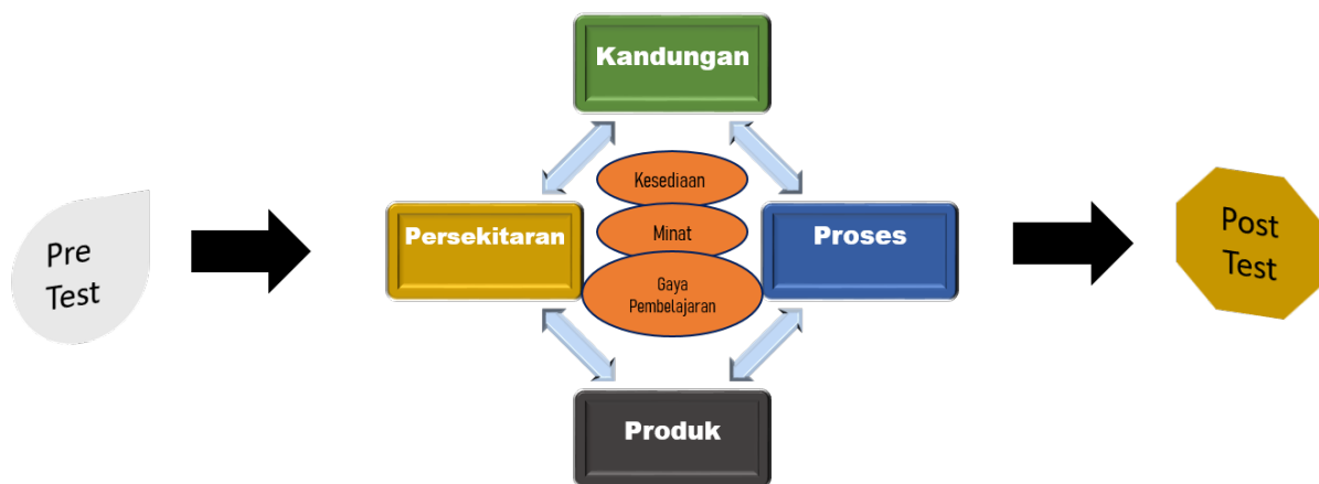
RAJAH 2. Menunjukkan Pelaksanaan Kaedah Terbeza di KGP

Pelajar yang lemah mungkin memerlukan bantuan guru untuk tunjuk ajar dalam kelas. Pelajar dalam kategori sederhana diberikan tugas daripada bahan bacaan yang telah disediakan oleh guru manakala pelajar yang laju (mahir) akan diberikan tugas yang lebih mencabar.