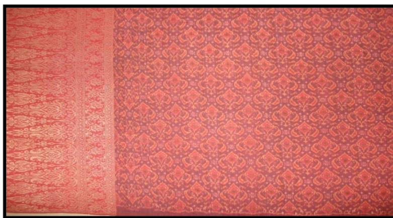
RAJAH 2. Kain Limar Bersongket Emas

Walaupun kadang kala penggunaan kaedah pewarnaan secara tradisional dianggap tidak produktif, namun bagi mengekalkan legasi serta kualiti secara turun temurun, kaedah tersebut dilihat amat menguntungkan negeri. Hal ini kerana, kebanyakan para pedagang luar berminat untuk mendapatkan produk yang diperbuat daripada bahan-bahan asli kerana dianggap lebih tahan lama serta bermutu tinggi. Ketika ini, kebanyakan pengusaha tekstil terdiri daripada kaum lelaki manakala kaum wanita lebih cenderung ke arah teknik-teknik penjualan sahaja. Situasi ini berlaku kerana pada ketika itu perkembangan ekonomi banyak dikaitkan dengan sikap “kerjasama” yang wujud dalam kalangan masyarakat Melayu terutamanya bagi pengusaha yang tinggal di kawasan-kawasan pedalaman. Tindakan yang dilakukan oleh baginda inilah ternyata membawa kesan yang cukup mendalam terhadap industri tekstil di Terengganu pada abad ke-19 (Hugh Clifford 1992).