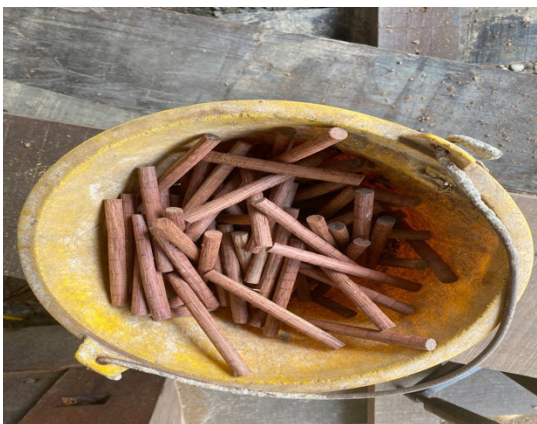
RAJAH 4. Pasak yang Dicipta oleh Tukang Timbal Perahu daripada Kayu Cengal di Terengganu bagi Menggantikan Paku

Apa yang paling unik dilihat dalam kegiatan perusahaan perahu di Terengganu pada ketika itu ialah dilihat dari segi teknik penghasilan sebuah perahu oleh tukang timbal. Hal ini kerana, seorang tukang timbal tidak memerlukan pelan untuk menghasilkan sebuah perahu dan menggunakan imaginasi bagaimana bentuk perahu, panjang dan lebar ketika itu untuk menjadikan sebuah perahu tersebut terapung di permukaan air (SP 6/39: Abdullah Muda, 2002). Ada ketikanya inovasi yang dilakukan bermula secara suka-suka untuk kepuasan diri sendiri atau kemudahan diri sendiri yang kemudiannya tanpa disangka berubah menjadi daya inovasi yang mampu membawa keuntungan kepada pengusaha tempatan (Majalah Dewan Ekonomi, Jun 2012). Malah, teknik pasak, menimbal dan penggunaan kayu cengal yang berkualiti juga merupakan antara teknik yang cukup unik dilihat dari segi penghasilan perahu di Terengganu. Penghasilan perahu inilah kemudiannya digunakan oleh masyarakat tempatan untuk menjalankan kegiatan perdagangan.