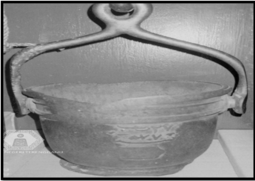
RAJAH 3. Timba Tembaga Masjid Sumber: Ihsan daripada Muzium Kuala Terengganu, 26 Mac 2013