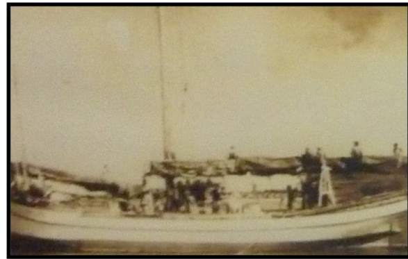
RAJAH 5. Perahu Pinis Gobel