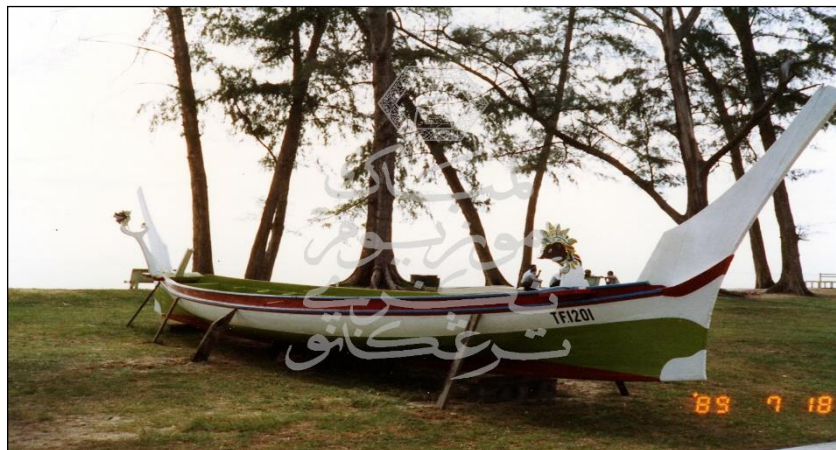
Foto 2. Pemodenan perahu kepada penggunaan kayu yang lebih kukuh.

Berdasarkan kepada gambar tersebut, jelas menunjukkan teknologi pembuatan perahu oleh orang Melayu pada masa tersebut. Teknologi pembuatan perahu yang digunakan adalah terdiri daripada kayu dan menggunakan getah daripada pokok gelam bagi melekatkan antara satu kayu dengan kayu yang lain. Penggunaan getah pokok gelam amat sesuai digunakan bagi menampung atau meredah air masin di lautan. Penggunaan getah gelam boleh membantu nelayan untuk pergi menangkap ikan di laut.