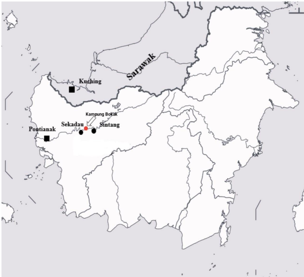
Peta 1. Lokasi Lembah Kapuas dan Kampung Bokak