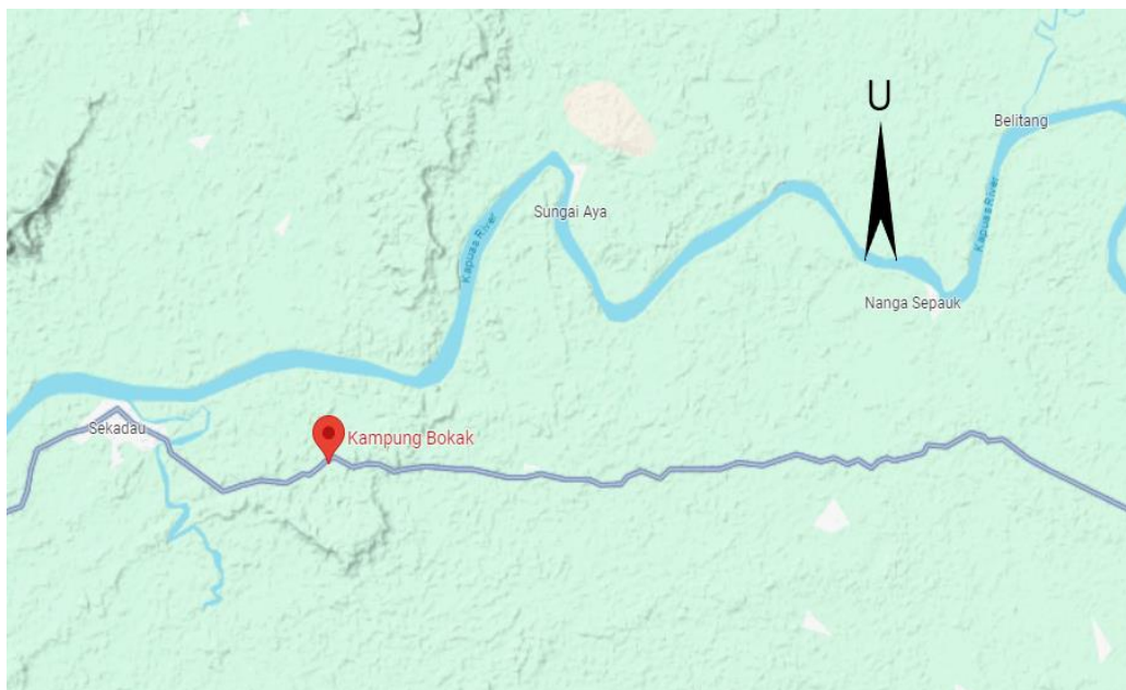
Peta 2. Lokasi kampung Bokak