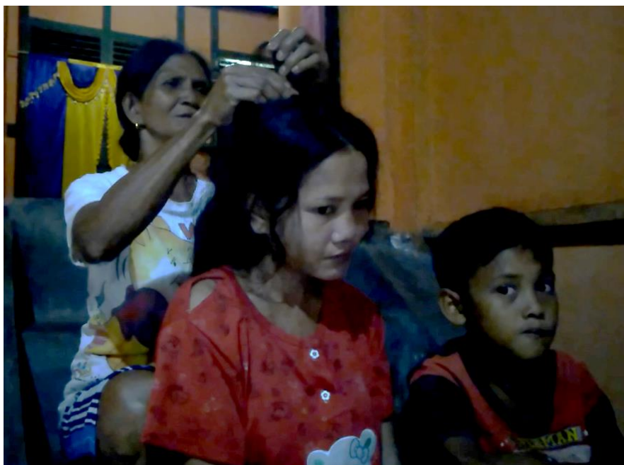
Gambar 1. Proses Untun' kedurok seorang anak yang diwakili ibunya.