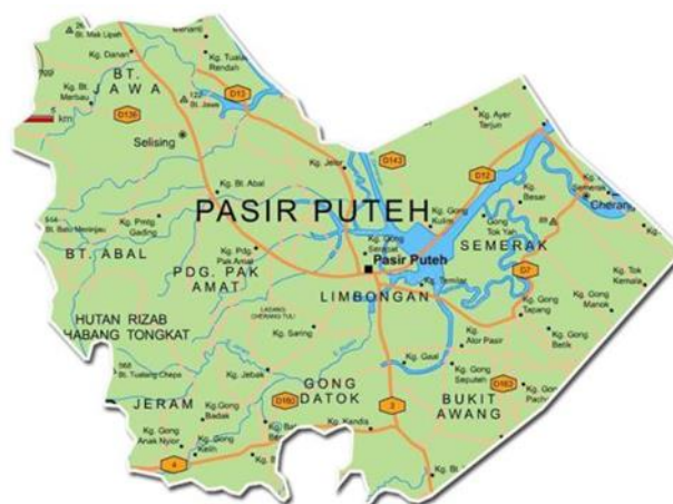
GAMBAR 2. Menunjukkan peta Daerah Pasir Puteh

Gambar 1 menunjukkan negeri Kelantan berkedudukan berada di sebelah Pantai Timur Semenanjung Malaysia bersebelahan negeri Terengganu dan Pahang. Kelantan juga bersempadan dengan Perak di Barat, Thailand di sebelah Utara dan Laut Cina Selatan di sebelah Timur. Kelantan berkeluasan 14,922 kilometer persegi dan mempunyai beberapa jajahan. Antara jajahan atau daerah yang terdapat di negeri Kelantan ialah Jajahan Kota Bharu, Pasir Mas, Bachok, Pasir Puteh, Tumpat, Kuala Krai, Gua Musang, Tanah Merah dan Jeli. Jeram Mak Nenek adalah dalam Jajahan Pasir Puteh.