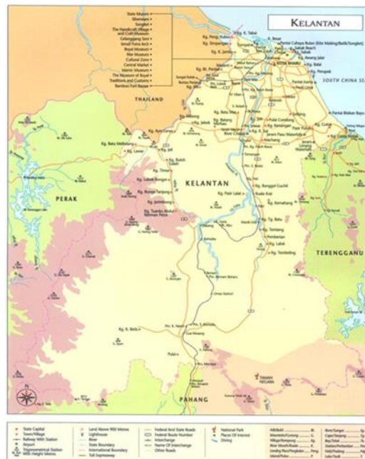
GAMBAR 1. Menunjukkan peta negeri Kelantan

membuatkan penduduk setempat juga kurang berminat untuk ke sana. Hal ini dikatakan sedemikian kerana mereka perlu berhadapan risiko yang tinggi sebelum ke jeram ini dengan meredah Hutan Simpan Kekal Cabang Tongkat terlebih dahulu.