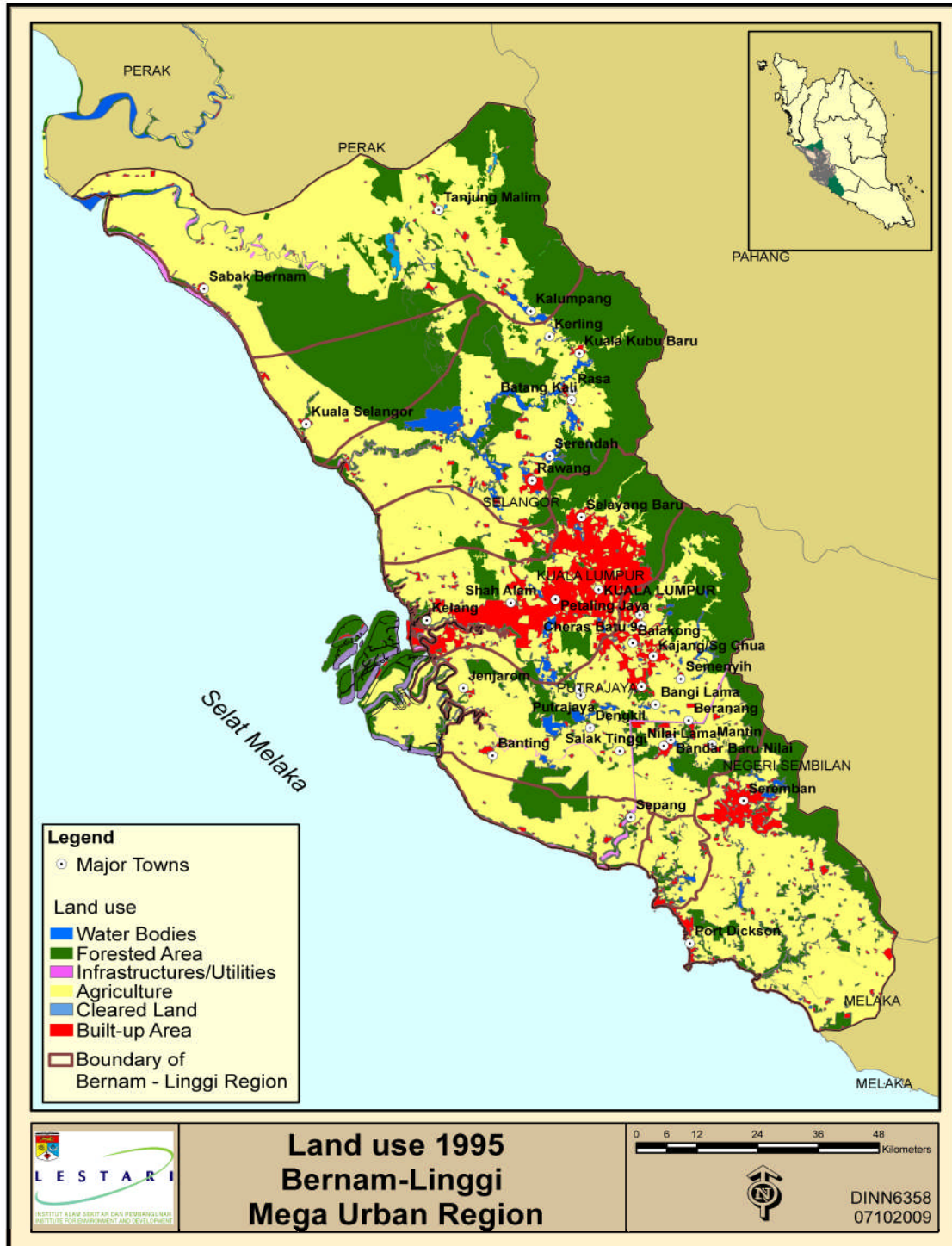
Rajah 1. Gunatanah Tahun 1995