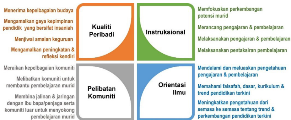
RAJAH 2. Kerangka Standard Guru Malaysia 2.0

Setiap domain dilengkapi dengan beberapa konstruk bagi memberi panduan kepada guru dalam mencapai tahap kompetensi yang diharapkan. Bagi domain kualiti peribadi, terdapat empat konstruk yang mendokong domain ini. Konstruk-konstruk tersebut ialah menerima kepelbagaian budaya; mengamalkan gaya kepimpinan pendidik yang bersifat insaniah; menjiwai amalan keguruan; dan mengamalkan peningkatan dan refleksi sendiri. Semua konstruk tersebut menggambarkan domain kualiti peribadi yang perlu dicapai oleh seorang guru dalam menunaikan tanggungjawab seorang pendidik. Domain kedua pula ialah domain pelibatan komuniti yang menyenaraikan tiga konstruk iaitu meraikan kepelbagaian komuniti; melibatkan komuniti untuk membantu pembelajaran murid; dan membina jalinan dan jaringan dengan ibu bapa/ penjaga serta komuniti luar untuk menyokong pembelajaran murid. Ketiga-tiga konstruk ini menjelaskan bahawa seorang guru perlu sentiasa membina hubungan yang baik bukan sahaja dengan komuniti dalam sekolah malah dengan komuniti luar sekolah di samping bersama-sama berpadu tenaga dan mengamalkan sikap bekerjasama. Secara ringkasnya, domain kualiti peribadi dan domain pelibatan komuniti mendidik guru supaya mempunyai tahap kompetensi bukan kognitif yang tinggi.