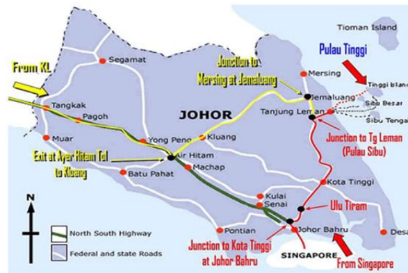
Rajah 1: Kedudukan Pulau Tinggi dalam Daerah Mersing, Johor

Pulau Tinggi ditadbir oleh beberapa pegawai kerajaan yang telah dilantik iaitu Ahli Parlimen, ADUN, Pegawai Daerah, Penghulu Pulau-pulau, ADO dan Ketua Kampung. Di Mersing, terdapat lima buah pulau yang diduduki penduduk antaranya ialah Pulau Sibul, Pulau Pemanggil, Pulau Aur, Pulau Besar dan Pulau Tinggi. Setiap pulau akan diketuai oleh seorang ketua kampung yang dilantik oleh DYMM Sultan Ibrahim ibni Almarhum Sultan Iskandar. Sebelum dilantik, mereka akan mengadakan proses pengundian untuk menentukan siapa yang lebih layak untuk memimpin pulau-pulau tersebut. Penghulu bagi pulau-pulau ditugaskan untuk menjaga kelima-lima pulau tersebut dari segi kebersihan, pengurusan serta pentadbiran.