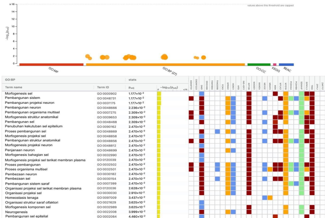
Rajah 2 Hasil keseluruhan analisis pengayaan GO dan tapak jalan bagi 28 gen yang memiliki mutasi de novo menggunakan g:Profiler.