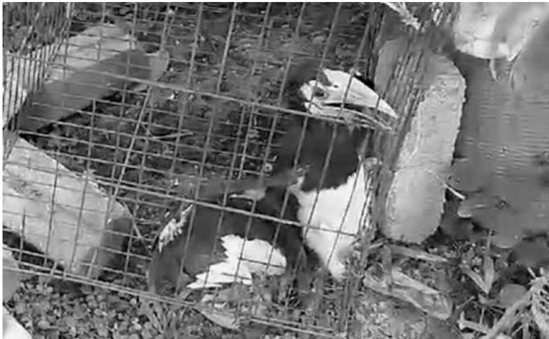
RAJAH 4. Gambar menunjukkan anak Enggang Kelingking yang ditinggalkan akibat gangguan berterusan pada sarang

serta persekitarannya dilihat sebagai satu faktor utama dalam meningkatkan kemandirian spesies terbabit. Tanpa bantuan seperti penyediaan serta penjagaan rapi kawasan sekitar sarang sedia ada, di samping pemerhatian berterusan oleh penduduk setempat, risiko kegagalan bersarang serta kematian anak enggang yang menetas adalah tinggi.