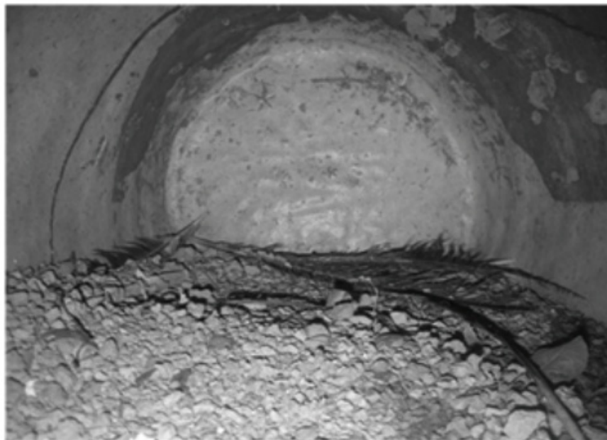
RAJAH 2. Tanah dan kerikil melapisi bahagian bawah sarang (Sumber asal: Ismail et al. 2015).

jantan selepas selesai memberi makan kepada pasangannya. Ini merupakan suatu perlakuan baharu yang belum pernah dilaporkan di mana-mana penerbitan saintifik sebelum ini. Secara umumnya, enggang yang bersarang di tempat tinggi tidak perlu bertindak sedemikian kerana sisa-sisa makanan dan najisnya adalah jauh lebih rendah daripada bukaan sarang. Maka perlakuan yang ditunjukkan oleh Enggang Kelingking di Sungai Panjang merupakan suatu adaptasi yang amat unik sekali.