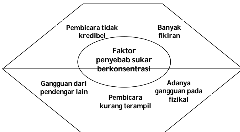
Rajah 2: Faktor penyebab pelajar sukar berkonsentrasi