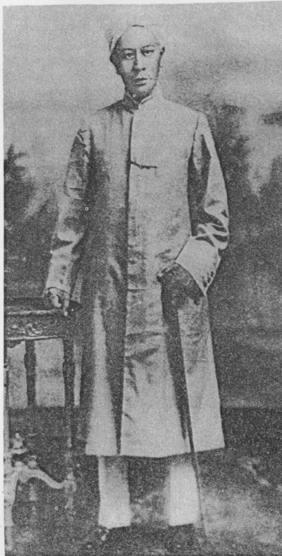
Gambar Foto 4.2 Sultan Zainal-Abidin III ibn Sultan Ahmad II, 1864-1918