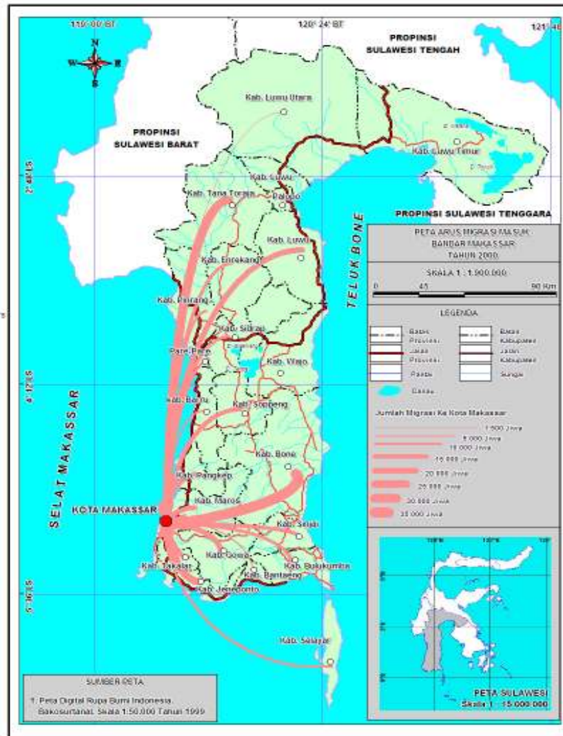
Rajah 2. Peta aliran migrasi masuk ke Bandar Makassar