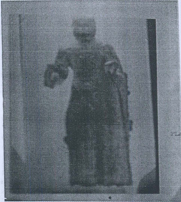
Gambar 3. Arca Buddha dari Lembah Kinta, Perak.

langgam Gupta sekolah Sarnath iaitu arca itu memakai jubah tanpa tanda lipatan. Tetapi seperti juga arca (Gambar 1), arca ini memakai jubah yang menampakkan bahu sebelah kanan.