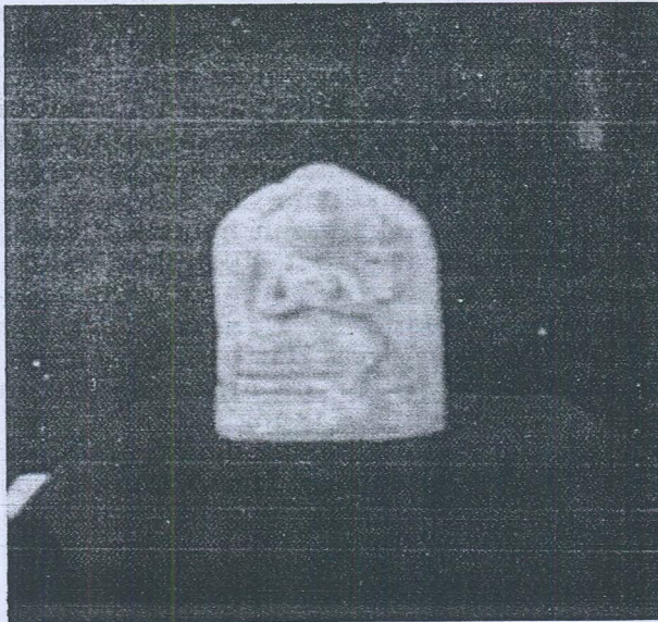
Gambar 7. Arca Avalokitesvara dari Lembah Bujang, Kedah.

Arca Avalokitesvara sedang duduk yang dibuat dari tanah liat (Gambar 7) tidak dapat dipastikan pengaruh langgamnya yang sebenar kerana saiznya terlalu kecil. Ini mengingatkan kita kepada beberapa buah arca agama Buddha dibuat dari tanah liat yang dijumpai di Gua Kurong Batang di Perlis 31 . Arca-arca itu dikelaskan sebagai Mahayana Votive Tablets juga diterima sebagai hasil ciptaan ahli-ahli seni agama Buddha tempatan pada abad ke 9 atau 10 Masihi. Tarikh itu diberi setelah dibandingkan dengan tarikh-tarikh arca-arca jenis itu oleh Coedes yang dijumpai di beberapa tempat di Selatan Thailand 32 . Kemungkinan juga arca dari Kampung Pengkalan Bujang itu mempunyai tarikh yang sama memandangkan arca-arca yang lain dari Tapak 21/22 itu mempunyai langgam Cola abad ke 10/11 itu.