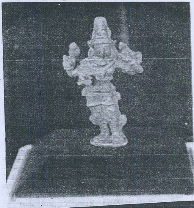
Gambar 6. Arca gangsa dewa, Bodhisattva yang sedang berdiri

Langgam yang dipengaruhi oleh India Selatan dapat dilihat lagi pada arca gangsa bodhisattva yang sedang berdiri (Gambar 6). Dewa ini mungkin Avalokitesvara berdasarkan kepada padma