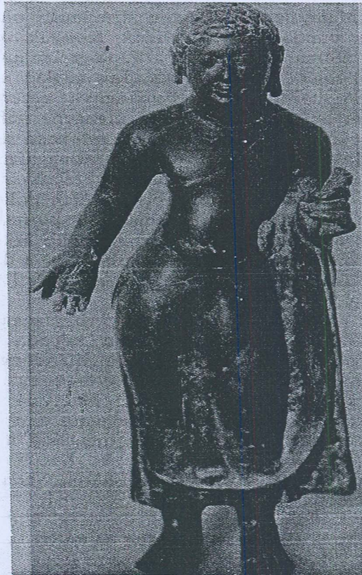
Gambar 1. Arca Buddha dari Tapak 16A, Lembah Bujang.

Teknik menggambarkan arca Buddha yang sedang berdiri memakai uttarasanga yang tidak berkedut mestilah dipengaruhi