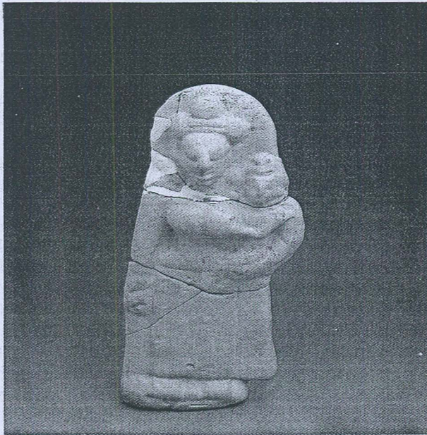
Gambar 8. Arca Hariti Sungai Mas.

Oleh kerana umur arca Hariti dari Peshwar itu lebih tua dari arca dari Candi Mendut maka arca Hariti Sungai Mas adalah lebih tua dari arca Hariti Candi Mendut. Berapa lama lebih tua itu tidak dapat dipastikan dengan tepat. Namun demikian berdasarkan kepada langgamnya yang hampir dengan arca dari Muzium Peshwar dan dengan arca-arca dari zaman Dvaravati maka kemungkinan besar ianya dicipta oleh ahli seni agama tempatan pada abad ke 6 atau 7 Masihi.