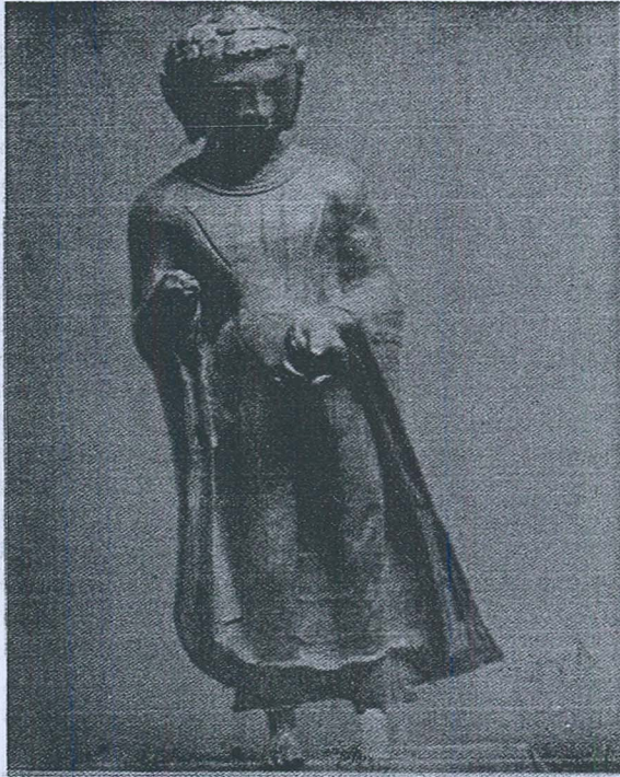
Gambar 2. Arca Buddha dari Pengkalen, Perak.

Ciri yang menarik tentang arca ini ialah tentang langgam uttarasanga yang diasaskan kepada sejarah seni Gandhara iaitu uttarasanga menutup seluruh badan dengan infleksi circumflex . Di atas uttarasanga kelihatan calar-calar yang menggariskan tanda kedut. Arah garis itu adalah keterangan utama yang dapat dikaitkan dengan pengaruh Ghandara . Tetapi garisan ini tidak banyak seperti yang biasa terdapat pada uttarasanga arca Buddha langgam Ghandhara 11 .