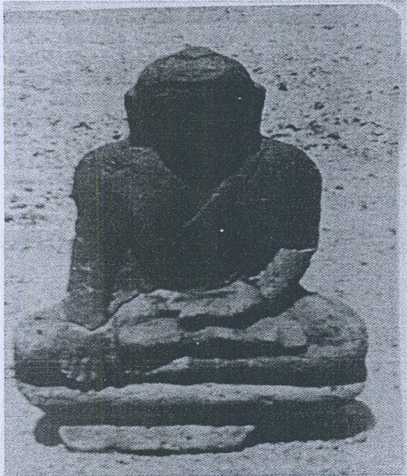
Gambar 5. Arca Buddha sedang duduk, Pengkalan Bujang, Kedah.

arca-arca itu yang telah rosak maka agak susah hendak menentukan umurnya. Berdasarkan kepada langgam sebuah daripada arca-arca Buddha yang sedang duduk (gambar 5) maka dapat dinyatakan bahawa langgamnya mirip kepada langgam zaman Cola pada abad ke 10 atau awal abad ke 11 Masihi.