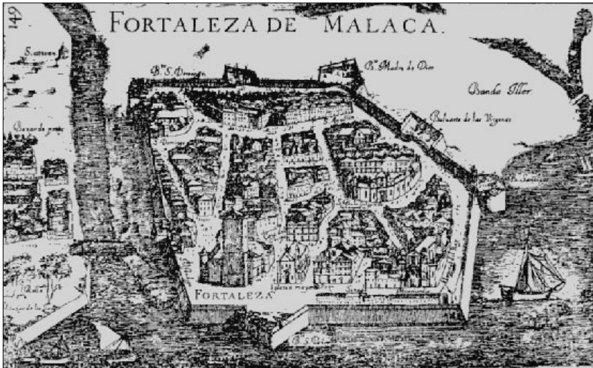
Melaka: Bandar berbenteng pada awal abad ke-17 (Manuel de Faria e Sousa, Asia Portuguesa )

bandar raja. Kita ketahui berdasarkan sumber-sumber Melayu bahawa tidak lama sebelum itu, kompleks istana sultan masih berada di hulu sungai, agak jauh dari bandar di sekitar pelabuhan. Di luar benteng ini, sisa wilayah bandar terbahagi menjadi beberapa kampung yang terpisah. Meskipun hanya dua di antaranya memiliki nama suku – Kampung Cina dan Kampung Keling – sumber tertulis mencatatkan bahawa sebahagian besarnya dihuni oleh orang asing, termasuk orang Jawa, Gujarati, Tamil, Brunei, Luzon dan seterusnya.