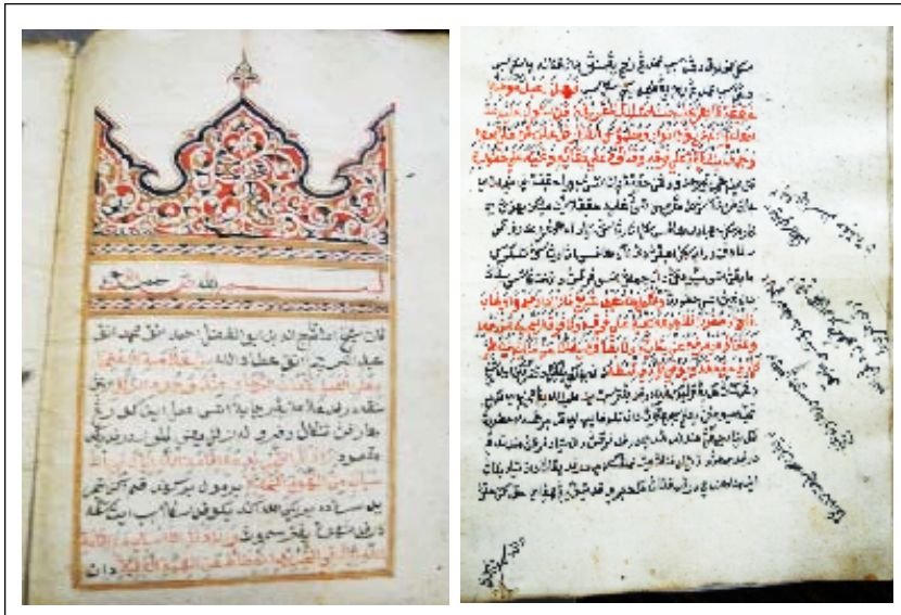
Foto 2. Gambar hiasan: Contoh ‘matn’ yang berbentuk penulisan ringkas di ruang tepi dan iluminasi yang menghiasi halaman pada Kitab Hikam

yang agak kucar kacir seperti tergambar pada Foto 2. Sesetengahnya pula berkeadaan kemas dan teratur. Ruang halaman digunakan sepenuhnya. Sehingga didapati seolah-olah tiada ruang untuk ditulis. Bahagian tepi dicoret catatan ringkas dimana ia dipanggil sebagai ‘matn’. ‘Matn’ satu istilah Arab yang bermaksud fakta utama seperti yang dinyatakan oleh Haji Abdul Aziz Ambak (pers.com. 2009). Huraian dari matn tersebut kebiasaannya diterangkan secara panjang pada ruang tengah halaman. Uniknyanya ‘matn’ tersebut dicoret secara bercorak. Seperti yang tergambar melalui Foto 2, manuskrip Kitab Hikam .