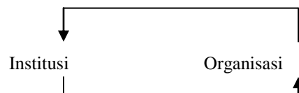
Rajah 1.1: Ilustrasi interaksi institusi dan organisasi yang membawa perubahan institusi

Dalam pada itu, North (1996) juga telah memberi penekanan terhadap kaitan antara institusi dan organisasi dan interaksi antara keduanya dalam membentuk perubahan institusi. North (1996) mendapati institusi bersama-sama dengan kecekapan ekonomi telah mengenalpasti peluang dalam masyarakat untuk terlibat dalam pembangunan tanah. Manakala organisasi dalam keadaan sebenar pula, cuba mencipta manfaat daripada peluang yang ada. Saling kait-mengait antara keduanya (institusi dan organisasi) akan membawa kepada perubahan institusi seperti yang digambarkan dalam ilustrasi di Rajah 1.1.