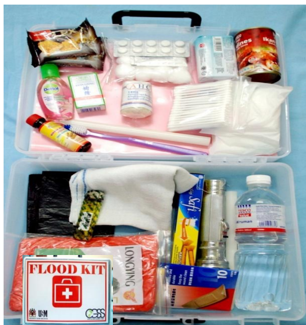
Rajah 5. : Contoh Barangan keperluan di dalam 'flood kit.'

Manakala, dari segi keperluan lain juga harus ditambah kepada jenis bantuan yang sedia ada contohnya mangsa banjir menginginkan lebih bantuan jenis makanan asas (74.1%); makanan yang seimbang (5.1%); makanan kering dan makanan segera (4.8%), makanan segar atau makanan basah seperti ikan segar, ayam dan daging serta sayur (9.8%); juga makanan kesihatan seperti vitamin (6.1%). Antara keperluan lain yang juga perlu diberi di pusat-pusat pemindahan banjir adalah seperti generator (92.2%) yang akan menjadi nadi kepada sumber elektrik untuk lampu dan mengecas telefon yang penting untuk melancarkan lagi sistem perhubungan, keperluan kepada tandas bergerak (87.0%) di pusat pemindahan yang terlalu padat, pengurusan sampah (86.7%) untuk menjamin kehilangan masalah bau busuk serta lalat, peralatan dapur dan memasak (92.2%), barangan untuk bayi serta menyediakan khemah (85.2%) untuk dijadikan pusat pemindahan kerana masih ada mangsa yang berpindah diatas jalan raya oleh kerana tiada pusat pemindahan atau pusat pemindahan ditenggelami air.