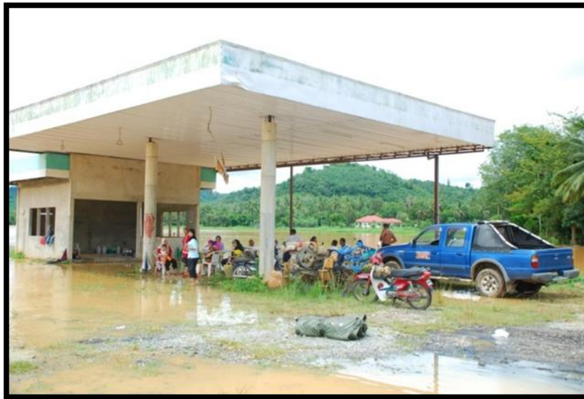
Rajah 2. : Pusat Pemindahan Banjir di Kampung Padang Balai, 2010.

Berdasarkan jadual 3 di atas, masalah seperti keselesaan, terlalu padat, bising dan masalah tempat tidur adalah menjadi masalah utama iaitu sebanyak 48.3 peratus. Hal ini juga menjadi punca mengapa timbulnya konflik di pusat pemindahan berlaku. Mangsa banjir yang berada dalam tekanan akibat dari kemusnahan dan juga kerosakan harta benda akibat banjir memerlukan suatu ruang yang selesa yang mungkin dapat mengurangkan tekanan kepada mereka. Kebanyakan mereka berpindah adalah kerana terpaksa disebabkan oleh faktor keselamatan dan di hati setiap mangsa banjir, mereka tidak mahu berpindah kerana ingin menyelamatkan harta benda mereka. Kebanyakan mangsa banjir duduk di pusat pemindahan banjir adalah sekitar 1 hari (25 %); 2 hari (18.7%); 3 hari (25.9%); 4 hari (12.0%) dan sehingga 7 hari lamanya (12.6%). Oleh itu, sedikit sebanyak permasalahan-permasalahan di pusat pemindahan banjir ini menjadi punca mengapa konflik timbul.