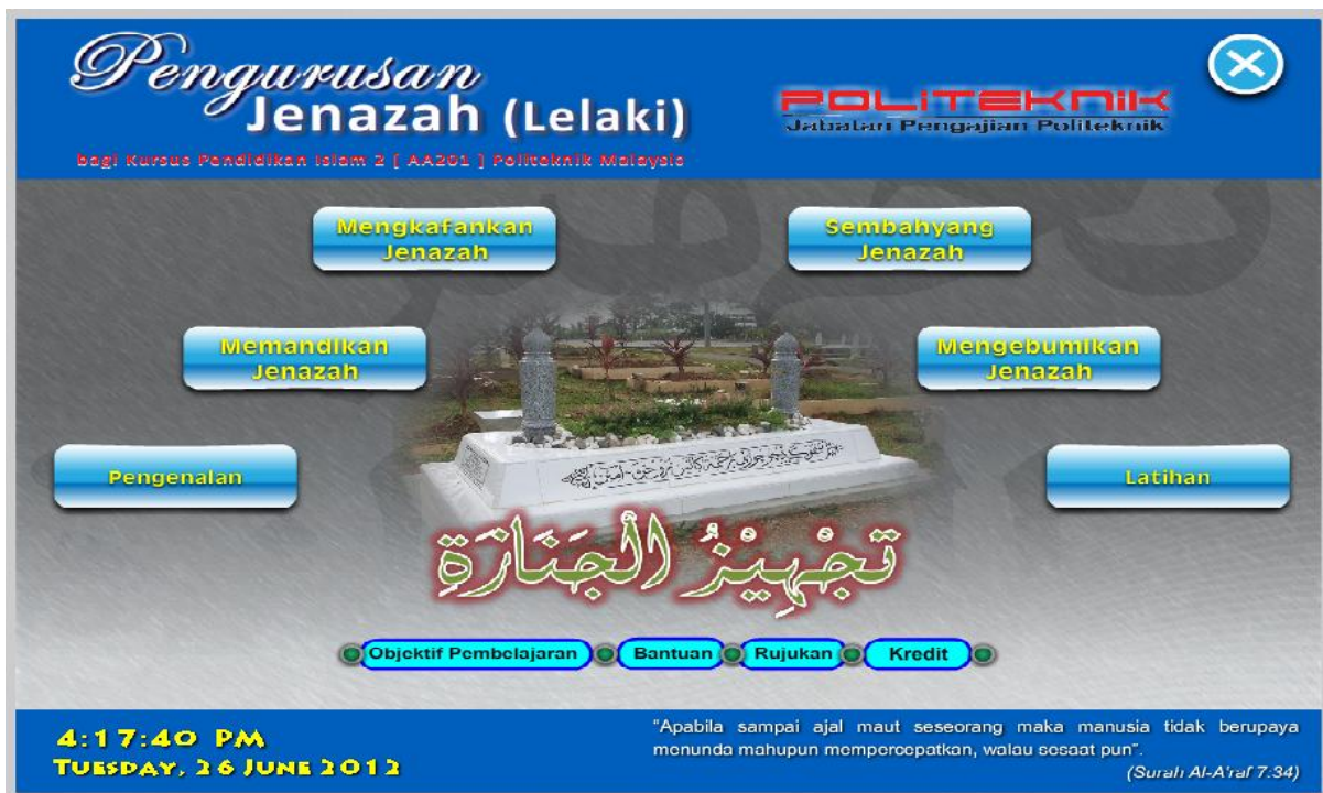
Rajah 2a Skrin Menu Utama

Seramai 40 orang pelajar semester 3 dan 16 orang pensyarah daripada Politeknik Ungku Omar, Politeknik Premier, Ipoh, Perak terlibat dalam penilaian sumatif ini. Kajian ini menggunakan instrumen soal selidik yang diambil daripada Zainur Ariffin (2008) dan Hasnah (2006) dan beberapa item telah diubahsuai mengikut kesesuaian kajian. Set soal selidik ini dibahagikan kepada empat bahagian, iaitu bahagian A (keperluan sukatan dan kurikulum), Bahagian B (elemen multimedia), Bahagian C (struktur pengajaran dan pembelajaran), dan Bahagian D (aspek interaktif dan mesra pengguna). Rajah dibawah menunjukkan beberapa snapshot yang diambil daripada perisian dibangunkan (Rajah 2a, 2b, 2c, 2d dan 2e).