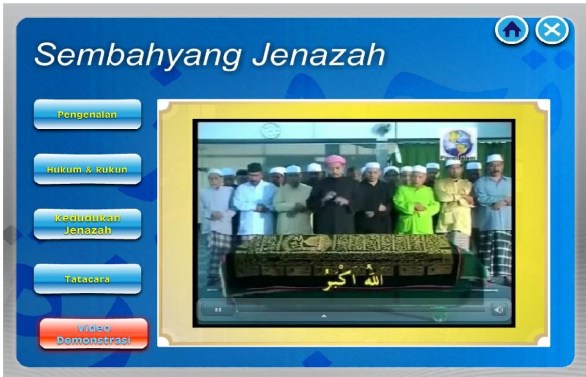
Rajah 2d Skrin Persembahan Maklumat (Video)