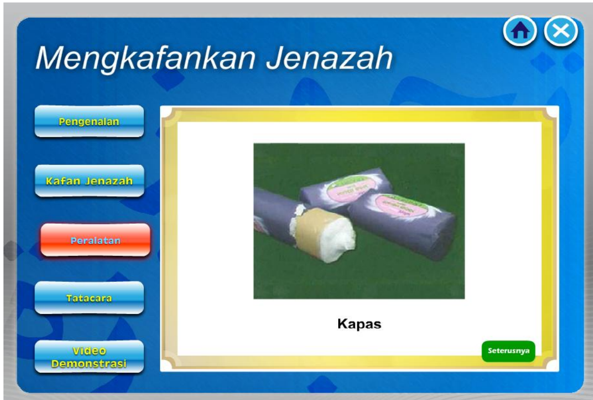
Rajah 2c Skrin Persembahan Maklumat (Gambar)