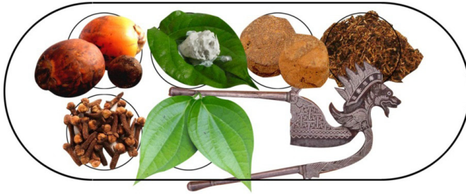
Gambar 2: susunan bahan-bahan di dalam tepak sirih.

Tepak juga membawa makna bahawa jika wanita bersetuju menerima pinangan lelaki, wanita tersebut juga mesti bersedia menerima segala cabaran yang bakal dihadapi dalam frasa kehidupan seterusnya. Bahan-bahan di dalam tepak yang diletakkan di dalam bekas kecil dinamakan cembul mempunyai pelbagai rasa seperti kapur yang mempunyai rasa pedas dan panas, gambir dan tembakau yang mempunyai rasa kelat dan cengkik yang mempunyai rasa segar. Daun sirih di dalam tepak mewakili wanita yang sentiasa dijaga maruahnyanya kerana ia diletakkan di dalam tepak yang bertutup. Daun sirih melambangkan wanita sebagaimana kehidupan pokok sirih yang tidak boleh hidup di kawasan terbuka dan perlu mempunyai sokongan untuk hidup. Daun sirih untuk adat meminang tidak boleh menggunakan daun sirih bertemu urat kerana daun sirih bertemu urat hanya digunakan untuk tujuan perubatan.