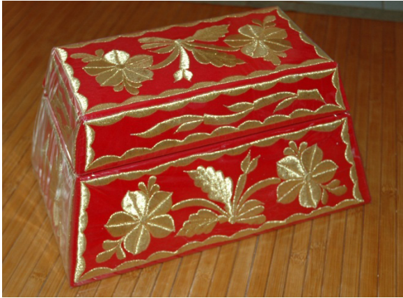
Gambar 1: Tepak sirih

Jasmani (1956) mendefinisikan tepak sirih ialah merupakan bekas khas untuk diletakkan sirih dan segala ramuannya yang diperbuat bertapak-kotak sama ada daripada bahan emas, tembaga atau kayu yang berukir.