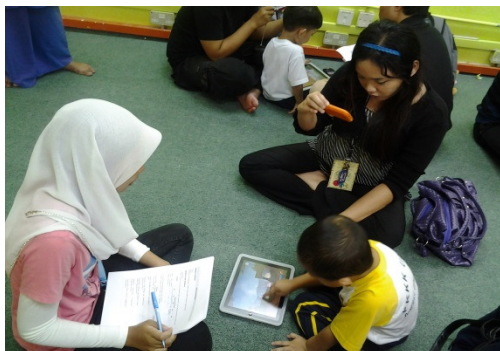
RAJAH 2. Penyelidik mencatat dan pemudah cara merakam video semasa sesi pemerhatian dijalankan