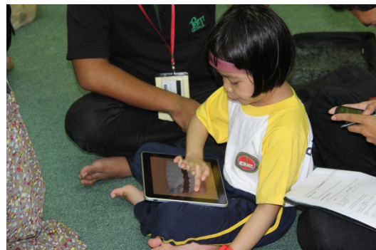
RAJAH 3. Peserta kajian bermain aplikasi permainan ( Daily Task ) menggunakan iPad