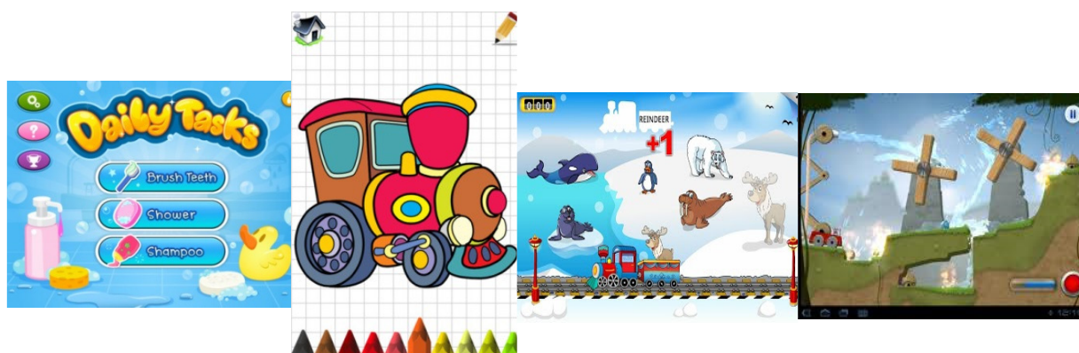
RAJAH 1. Paparan skrin aplikasi permainan (i) Daily Tasks , (ii) Coloring Book , (iii) Animal Train , dan (iv) Sprinkle .

Penyelidik mengguna iPad 2 sebagai perwakilan gajet skrin sesentuh kerana saiz skrinnya yang lebar iaitu 9.7 inci (pepenjuru). Saiz skrin yang besar dapat menyedia paparan antara muka aplikasi yang jelas dan memudah kanak-kanak mengendali gajet dengan selamat (Anthony et al., 2014). Empat jenis aplikasi permainan dimuat turun secara percuma daripada Apps Store iaitu (i) Daily Tasks , (ii) Coloring Book , (iii) Animal Train , dan (iv) Sprinkle . Pemilihan aplikasi permainan ini adalah berdasarkan kepada kandungan permainan yang bersesuaian dengan konsep didik hiburan. Kandungan permainan berbentuk pendidikan dan tidak dipengaruhi oleh unsur negatif seperti keganasan dan pornografi (Facer, 2004). Pemilihan juga mengambil kira tahap umur dan kerumitan pergerakan sentuhan bagi mengelak kanak-kanak menghadapi kesulitan dalam gerakan ergonomik yang sukar.