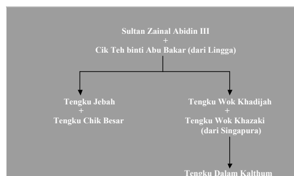
JADUAL 1 Salasilah Tengku Dalam Kalthum

Penulis berpandangan, nilai sebenar Syair Tawarikh Zainal Abidin Yang Ketiga adalah bergantung kepada kebenaran yang terkandung di dalam syair tersebut, khususnya yang lahir daripada minda kepengarangan seorang pengarang yang memang sangat diyakini mempunyai kewibawaan dalam melakarkan kisah sejarahnya. Tengku Dalam Kalthum adalah pengarang yang mewarisi secara langsung tradisi sejarah istana Terengganu, sama ada secara bertulis atau lisan, sama ada melalui dokumen-dokumen istana ataupun melalui cerita-cerita yang didengarnya daripada ibunya atau daripada kalangan ahli kerabat raja-raja Terengganu. Walaupun beliau melihat sesuatu isu daripada kaca mata pengarang istana, tetapi nilai kebenaran masih kekal terpelihara, sekurang-kurangnya masih tidak bersalahan daripada bukti-bukti sejarah yang diperoleh para sarjana kemudiannya.