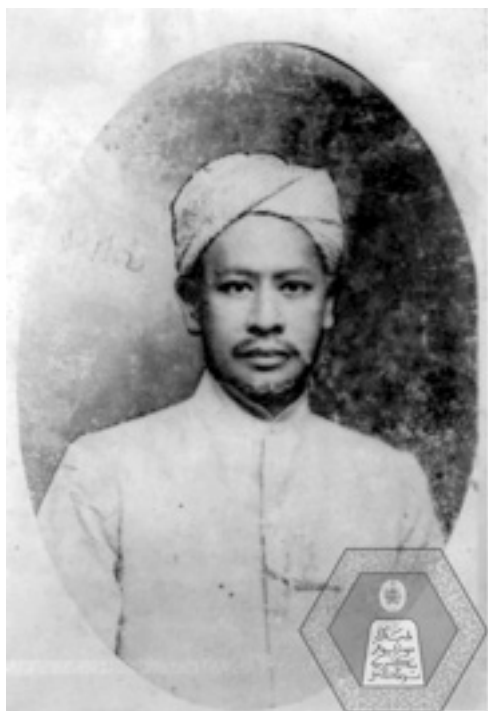
FOTOGRAF 1 Sultan Zainal Abidin III (1881-1918)

yang sedang dilanda kemajuan moden Barat. Kajian-kajian yang lebih mendalam terhadap hasil-hasil persuratan Terengganu abad ke-19 tersebut akhirnya membawa kepada penemuan-penemuan penting tentang keperibadian Sultan Zainal Abidin III sebagai seorang model pemerintah yang sangat memelihara budaya hidup masyarakat Melayu sama ada dari sudut budaya material mahupun budaya pemikiran dan intelektualnya.